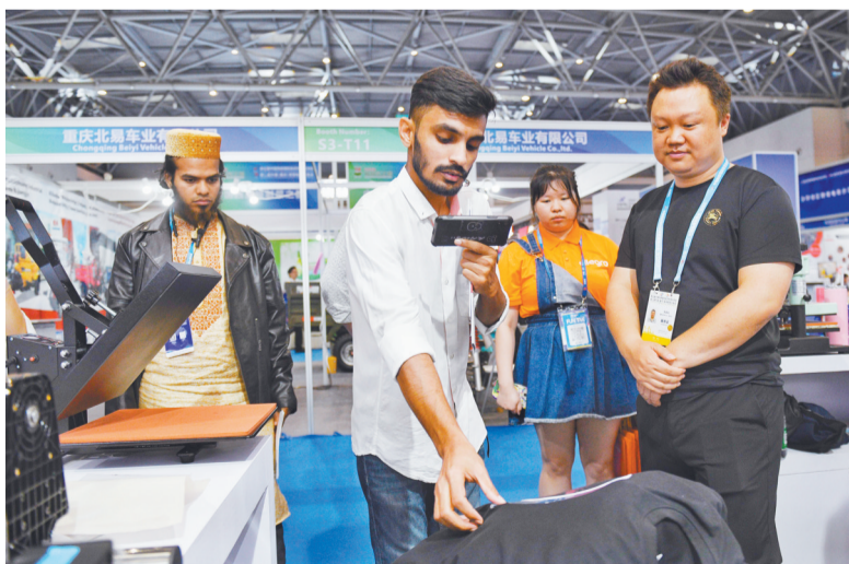
▲5月18日,西洽会跨境电商专区,“中国造”服装设备吸引了海外客商的关注。