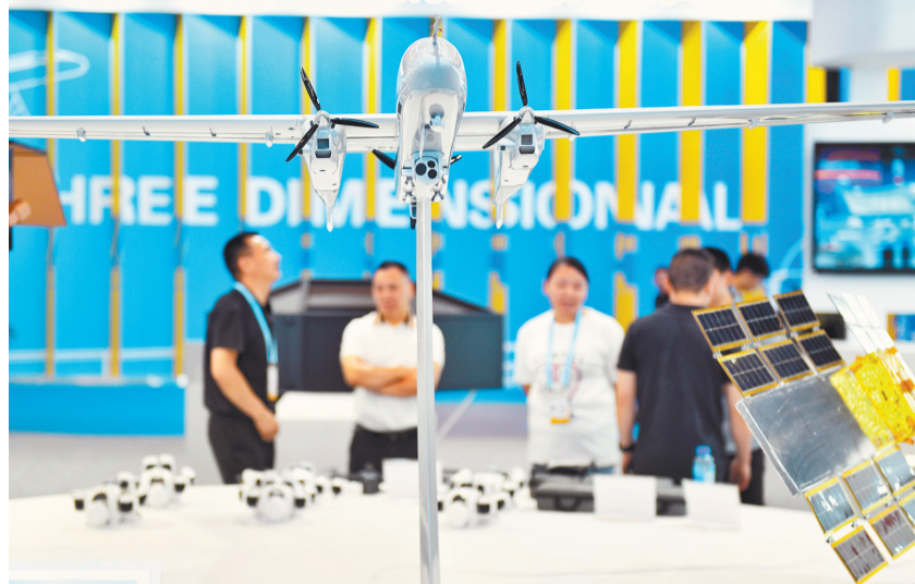
5月18日,重庆国博中心,第五届西洽会四川展台,客商正在了解航天设备。

在N4的物流馆,四川大型企业——蜀道集团展示了自己在物流运输领域的成果,其中有不少涉及川渝合作