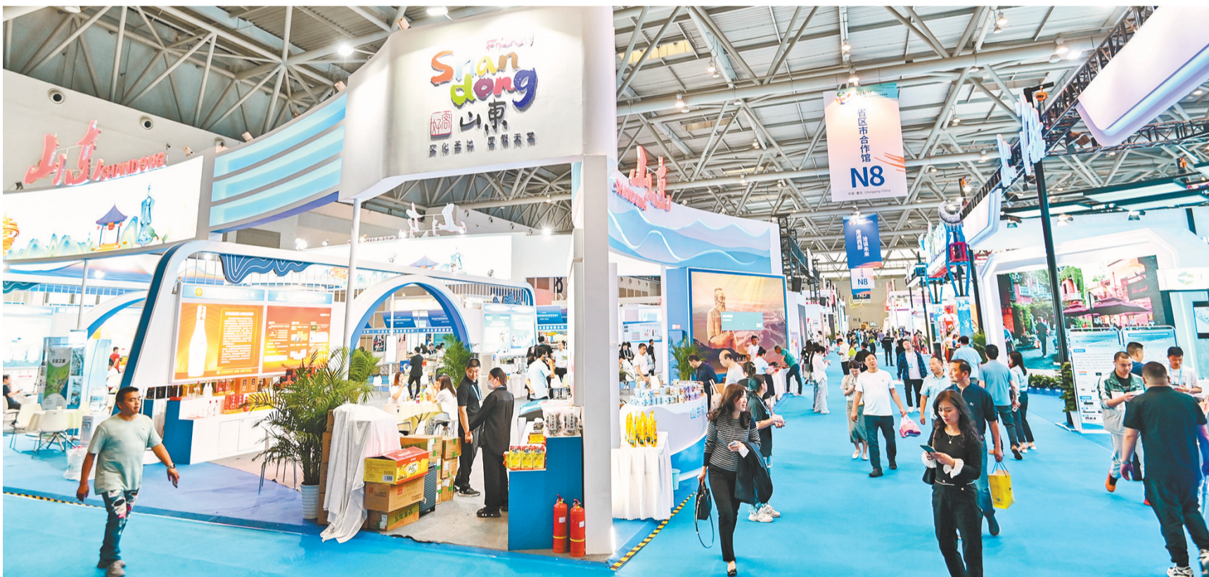
▲5月19日,重庆国博中心,众多市民和参会人员正在N8省区市合作馆参观。