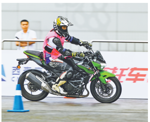
▲5月19日,重庆国博中心,金卡纳摩托车技巧绕桩赛现场,选手正在争分夺秒进行比赛。