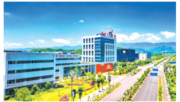
垫江高新区

随着一条条通道连接四方，一箱箱货物组团出海，一个个产业生机盎然，垫江县正以蓬勃奋进之姿全面塑造竞争优势，迸发出高质量发展的澎湃动能。