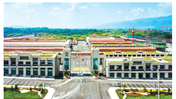
中农联·渝东国际农贸城

广邀天下商 欢迎致电垫江招商服务热线 垫江县招商投资促进局:02374667880 垫江高新技术开发区:02374533123