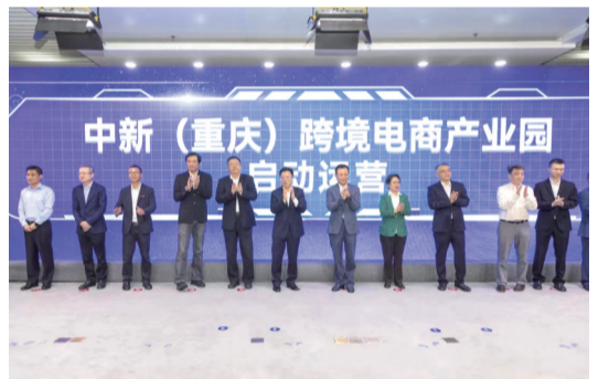
中新(重庆)跨境电商产业园启动运营活动现场

工厂产量,2022年货物进出口经陆海新通道集装箱量占全区本土企业总量的八成以上。 业态方面,江北区首创跨境电商“前店后仓+快速配送”模式,创新“保税物流”等贸易新方式,汇聚阿里巴巴、亚马逊等跨境电商企业100余家,平台企业30余家,跨境电商交易额已占到全市总量的一半以上。 “大流通+大外贸”合力成势,2022年,江北区实现进出口额955.3亿元,同比增长41.38%,增幅排名全市第一,今年一季度,完成进出口额246亿元,占全市总额14%,同比增长53.1%,增速中心城区第一,仍保持着强劲的开放势头。