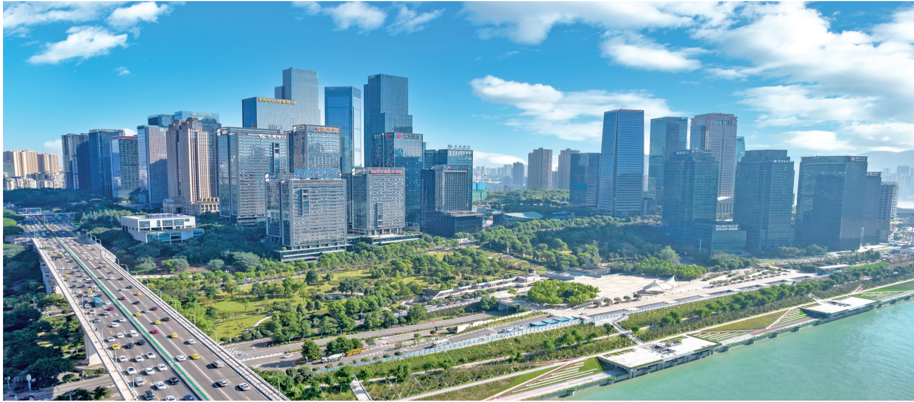
江北嘴中央商务区