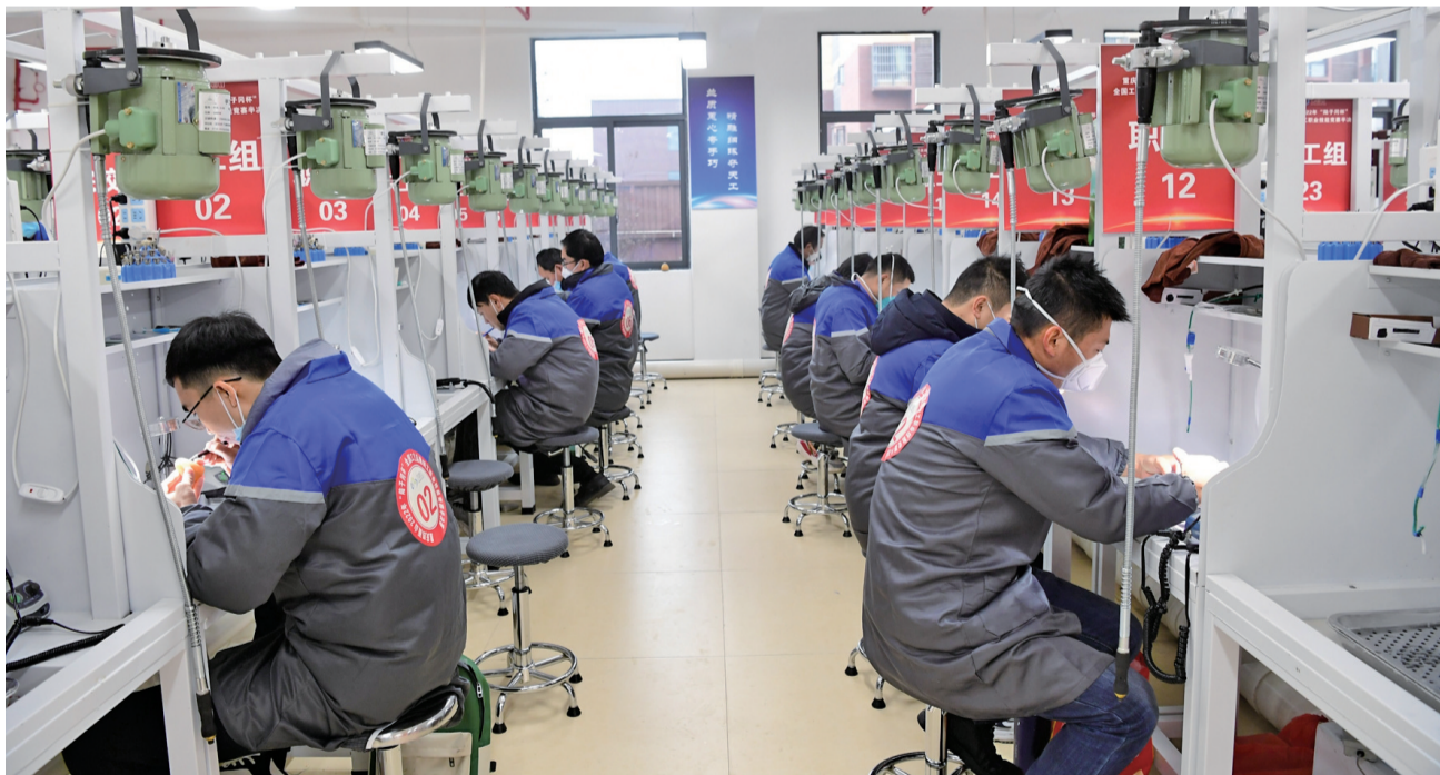
江津承办重庆首次国家级玉石雕刻职业技能大赛

年,中国轻工珠宝首饰中心先后组织近百名珠宝玉石专家到江津品鉴江津玉。多位专家一致认为,江津玉籽料的品质非常高,达到了玉石级标准,江津玉的发现填补了重庆一直没有玉石产地的空白。