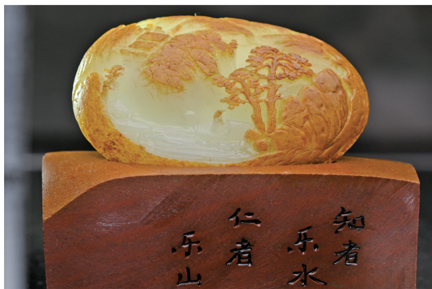
江津玉雕刻作品展示