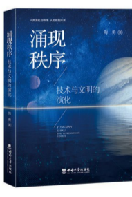
《涌现秩序:技术与文明的演化》 作者:陶勇 出版社:西南大学出版社