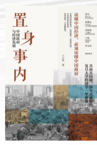
《置身事内:中国政府与经济发展》 作者:兰小欢 出版社:上海人民出版社