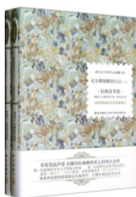
《尼尔斯骑鹅旅行记》 作者:[瑞典]塞尔玛·拉格洛芙 译者:杨芳如 出版社:新星出版社

这部获得诺贝尔奖的童话,其作者拉格洛芙也是第一个获得诺贝尔文学奖的女作家。原书有40万字,对于爱读长篇小说的小朋友而言这本名著会让你不忍释卷。小说受到世界各国儿童和青少年的喜爱,它被改编为影视剧、舞台剧等多种形式。这也是我读过的最长的一本儿童文学著作,作家通过生动的故事情节,真实记录了瑞典的地理、动物、植物、文化古迹,以及少数民族地区人民的生活风俗习惯。印象最深的是当小主人公尼尔斯发现要变回原来的样子,必须以牺牲公鹅莫顿为代价时,他宁愿不再变成人,也不愿背信弃义出卖朋友。这个情节彰显出对正义的渴望,对小朋友来说有着润物细无声的教育作用。