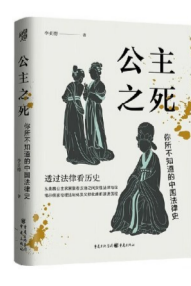
《公主之死:你所不知道的中国法律史》 作者:李贞德 出版社:重庆出版社