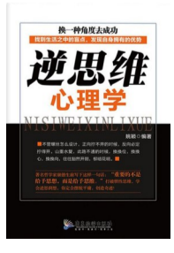
《逆思维心理学》 作者:姚颖 出版社:广东旅游出版社

生活中不乏许多思想僵化、需要调整认知的人。他们困于现状无法突破,深陷某种怪圈。这本书有助于突破惯常思维,甚至实现命运的改变。书中的观点和心理咨询中的一种疗法有着异曲同工之妙——接纳承诺疗法(ACT),也就是变“心理僵化”为“心理灵活性”,作者用浅显的案例充分论证了这个理论。如果你是一位追梦者,或者正困在陈旧观念、僵化思想的“死胡同”里,你会从书中发现“山重水复疑无路,柳暗花明又一村”。如果你正处于人生低谷、感觉前途一片黯淡,本书会助你拥有洒脱与旷达。如果你一直很努力却久久得不到回报,不妨换个角度看,换个思路想想。