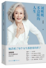
《刘明明:不设限的人生》 作者:刘明明 出版社:重庆出版社