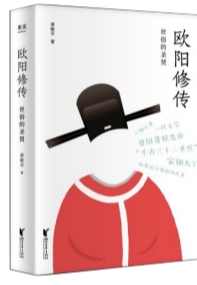
《欧阳修传:世俗的圣贤》 作者:章敬平 出版社:浙江文艺出版社

高中时读过的《醉翁亭记》,让我对欧阳修产生了深刻印象。一句“人知从太守游而乐,而不知太守之乐其乐也”饱含的“乐民之乐”的情怀令人感慨。章敬平所著这本《欧阳修传:世俗的圣贤》让我们更深入地认识欧阳修这个人。他出身较低,遭遇诸多磨难,与普通人经历很相似,但他可贵的是总能乐观地面对挫折,活得自在而洒脱。欧阳修还是一位杰出的辩手和名臣,也是一个擅长发现人才的管理高手,“唐宋八大家”中的苏洵、苏轼、苏辙、王安石和曾巩都是他的门生。如果想了解欧阳修的传奇人生和成功之道,这本书你一定不能错过。