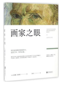
《画家之眼》 作者:[美]安德鲁·路米斯 译者:陈琇玲 出版社:北京联合出版公司

天才艺术家的脑洞,真的超乎常人想象。这本书涉及具体绘画技法的部分并不多,而是将绘画需要注意的12个要素进行了解释性的概括,如果你有一些绘画基础,那么阅读本书的收获可能会更多。该书难得之处在于,这是一本讲述创作心态和创作本身的书。作者的审美心得简而言之就是,只要用取悦自己的方式去画,就能画出一幅好画。审美这个过程中,最关键的是做自己,不要因为别人的说理,含混不清的解释和推销辞令,就盲从别人的经验。你自己从绘画实践中感受到的喜悦,才是你畅游艺术王国时最应追求的东西。