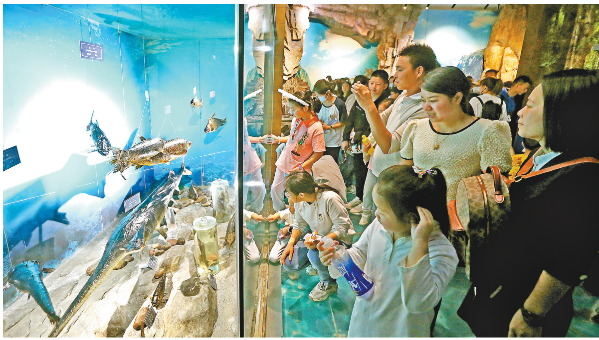
4月30日,游客们正饶有兴致地在重庆(中国)三峡博物馆参观游玩。

重庆市酒店行业协会相关负责人介绍,从酒店住宿业的预订量情况来看,今年“五一”假期,重庆酒店住宿业预计比2019年同期增长三成左右。