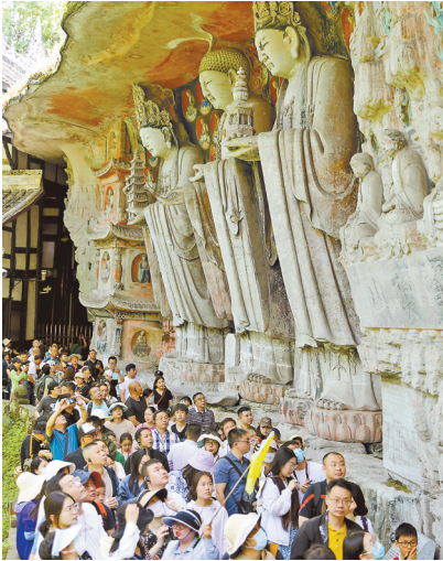
4月30日,大足宝顶山石刻景区,前来参观世界文化遗产大足石刻的游客络绎不绝。