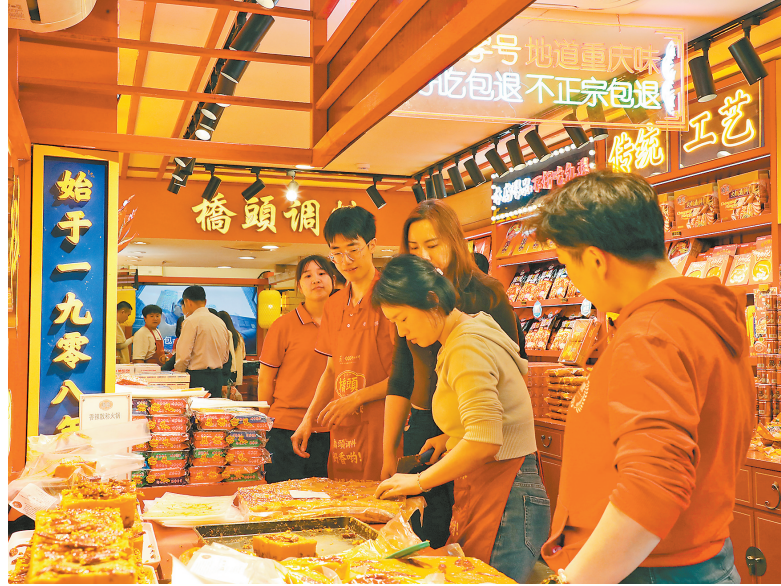
4月30日,沙坪坝磁器口古镇,游客们品尝特色美食,感受别样风韵。