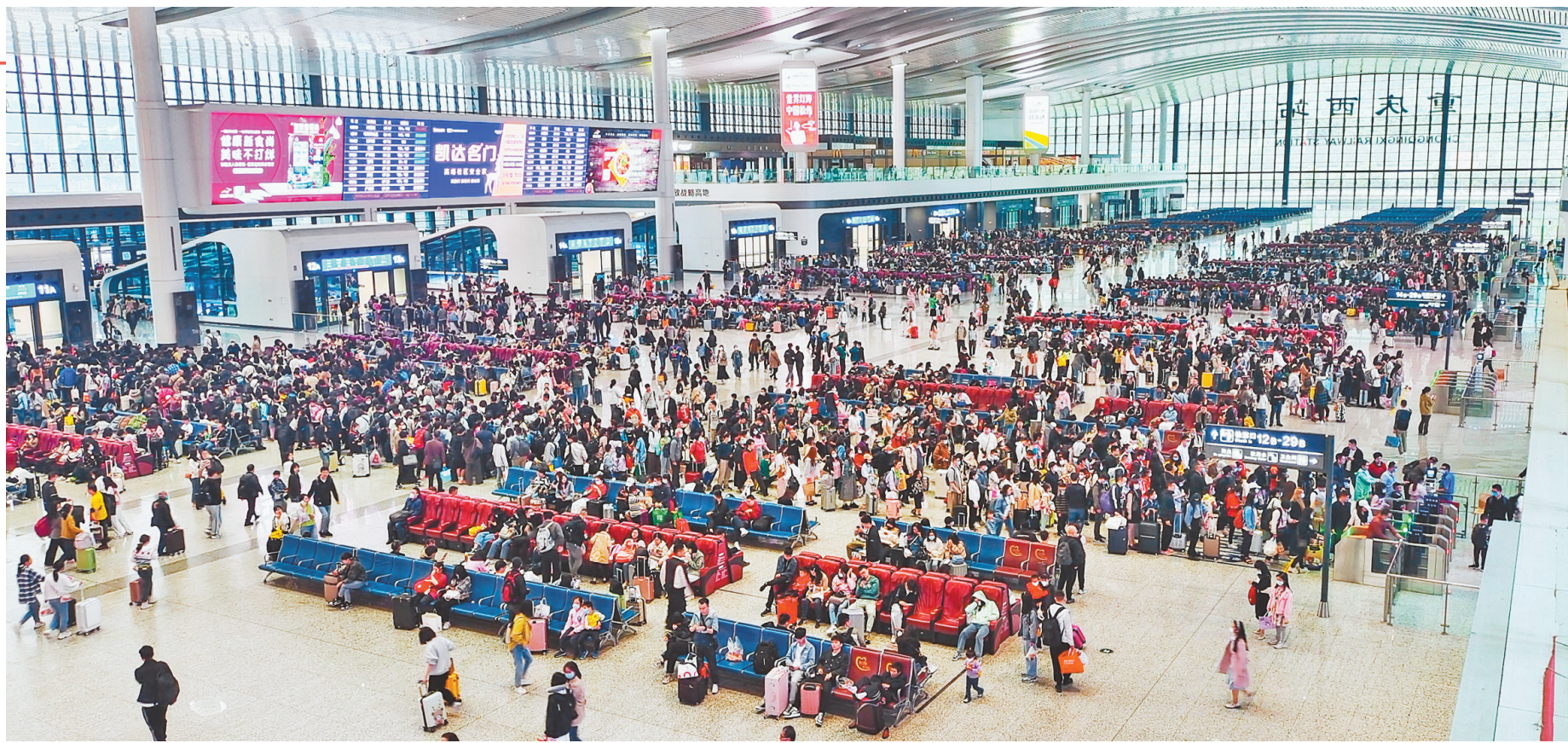
四月二十九日，「五一」小长假首日，重庆西站迎来旅客出行高峰。