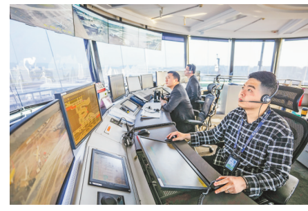
重庆江北机场机坪塔台,工作人员正在认真核对航班信息并及时沟通。

节假日总是机场最繁忙的时候。据了解,今年“五一”期间,重庆江北机场预计起降架次将超过4500架次,旅客吞吐量超过