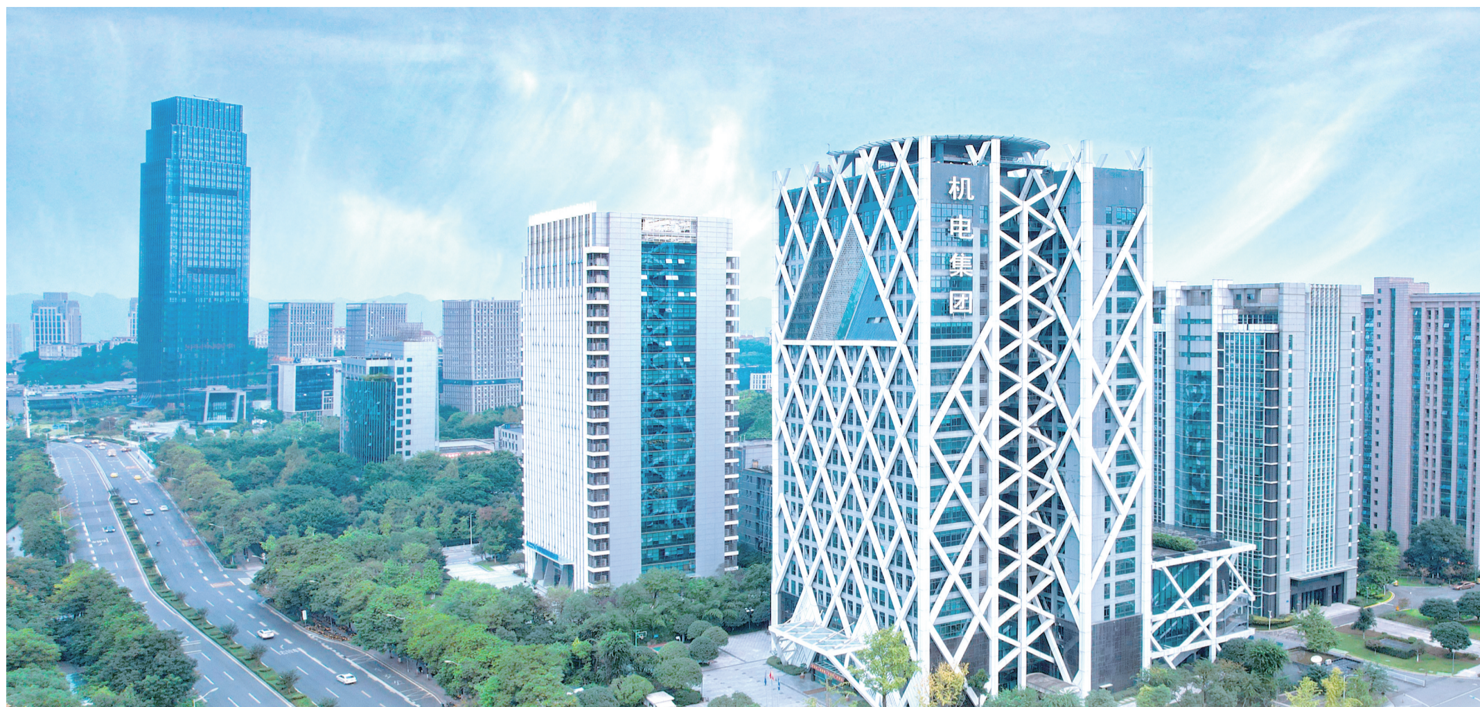
重庆机电控股(集团)公司