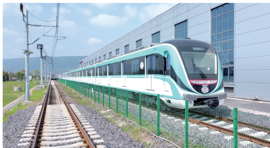
重庆中车长客生产的轨道交通18号通车

市场拓展实现新突破。近年来,重庆机电集团围绕做大总量、做强存量、做优增量,积极融入“一区两群”协调发展、成渝地区双城经济圈建设,进一步深化了与央企、川渝企业以及重庆区县政府的战略合作,实现了所属企业在电力、轨道交通和汽车等领域的市场拓展。2022年,通过以上合作,集团所属企业新增订单14.4亿元,同比增长19%。