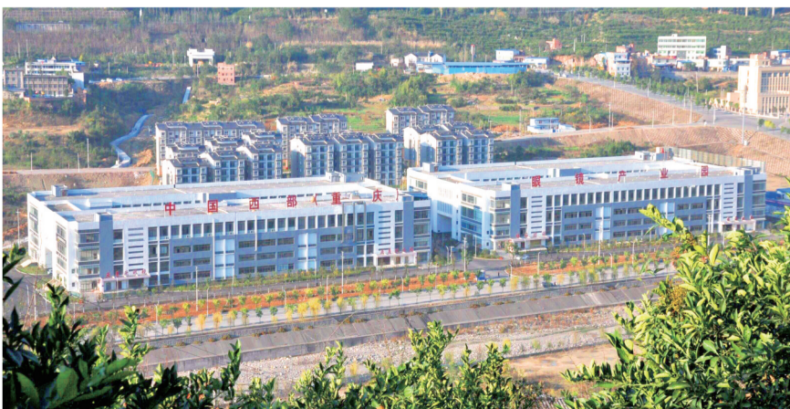
中国西部(重庆)眼镜产业园

数据是最好的证明：今年第1季度，奉节县招商引资新增签约项目103个，协议投资额133.4亿元，完成全年招商任务的41.7%，被授牌市县协同招商示范基地；固定资产投资实现增长16.3%，增速排全市第12位。