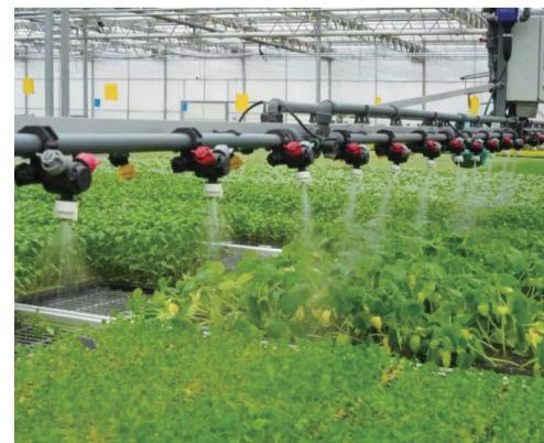
智能灌溉系统对种苗进行精准灌溉