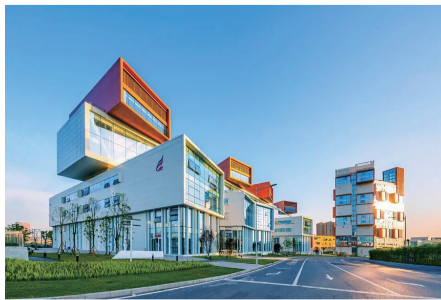
位于仙桃数据谷的重庆邮电大学工业互联网现代产业学院