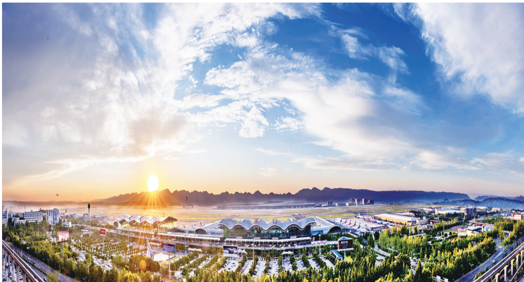
重庆江北国际机场