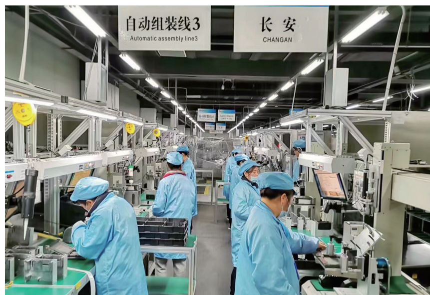
北斗星通智联科技公司产线生产