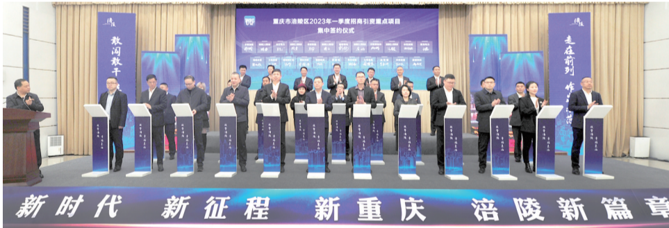
涪陵区2023年一季度招商引资重点项目集中签约仪式