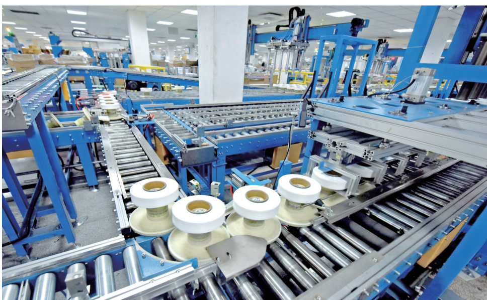
华峰重庆氨纶有限公司智能化生产车间

今年2月17日,总投资约100亿元的青山瑞浦兰钧年产30GWh电芯及PACK项目签约落户涪陵。青山控股与华峰集团是战略合作伙伴,青山瑞浦兰钧项目正是在后者的