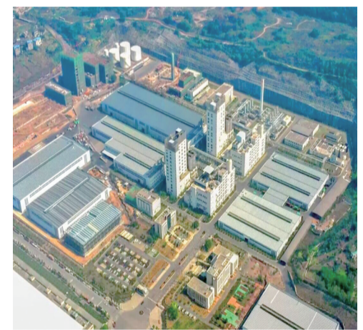
重庆万凯新材料科技有限公司

消费,对促进经济增长起着至关重要的作用。除了培育优质项目带动,涪陵还以消费推动经济稳定增长。