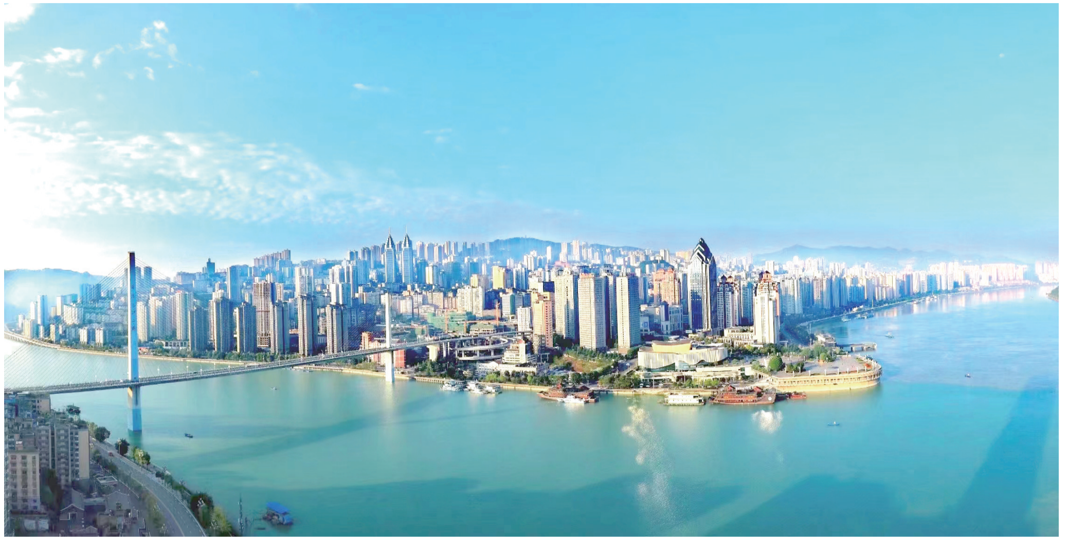
两江福地 神奇涪陵 产业强区 创新高地