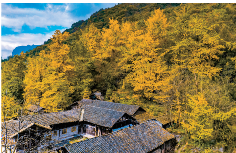
德隆镇银杏村金色老屋