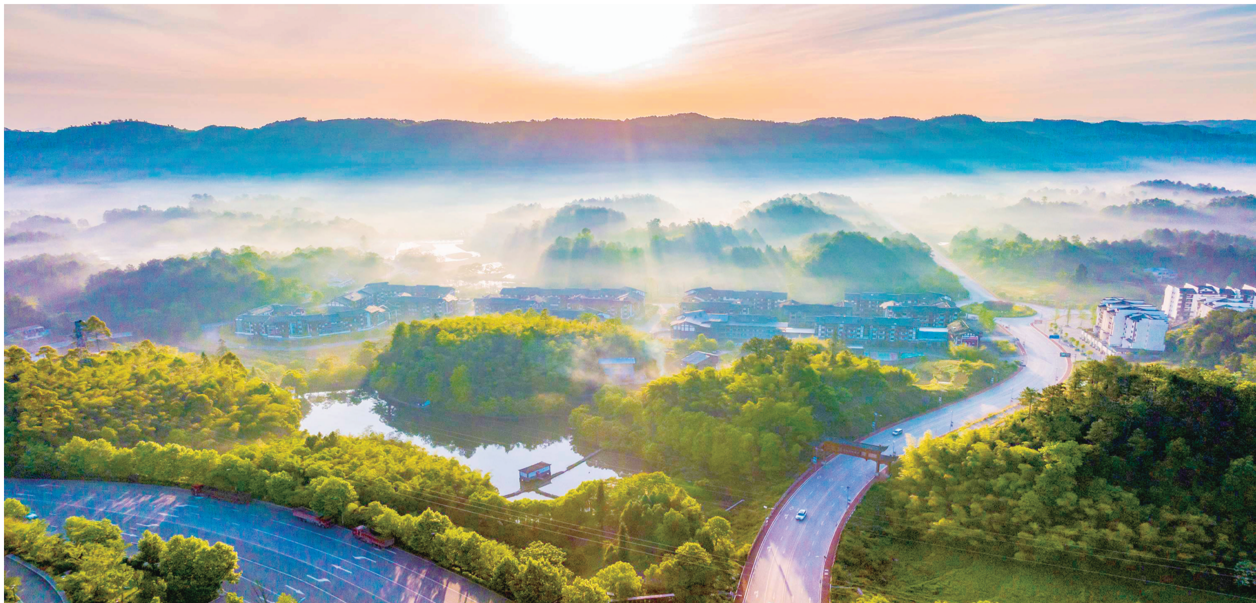
大观镇铁桥村