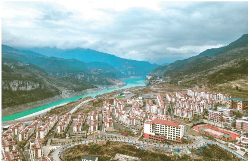
金山湖畔的头渡镇

古村落是“活”的文物,是南川精神文化的重要归宿,如何平衡好保护与发展之间的关系,是南川正在奋笔疾书的一张新答卷。