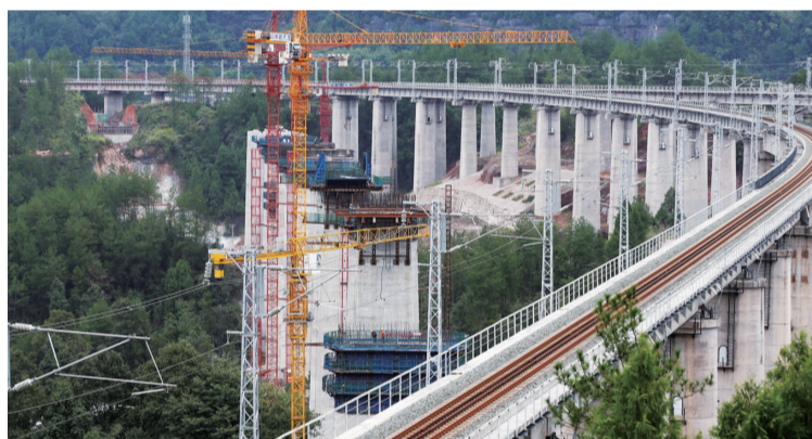
支持渝湘高铁重庆至黔江段项目加快建设,填补渝东南高铁空白。

截至目前,该行已先后向东线通道的渝湘高铁、中线通道的渝黔高速扩能项目等铁路、高速公路基础设施项目投放资金超400亿元,为这一揽子基础设施建设提供了坚强的金融保障,助力以便捷高效的通道建设引领形成枢纽支撑、衔接高效、辐射带动的全面发展格局。