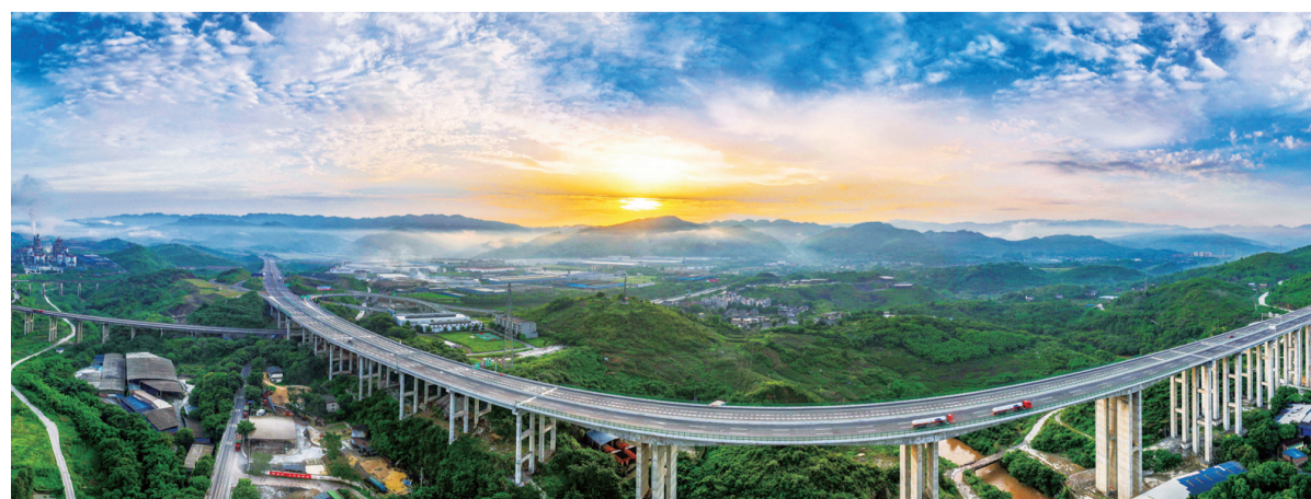
支持渝黔高速公路扩能项目实施,绘就重庆“南大门”新画卷。