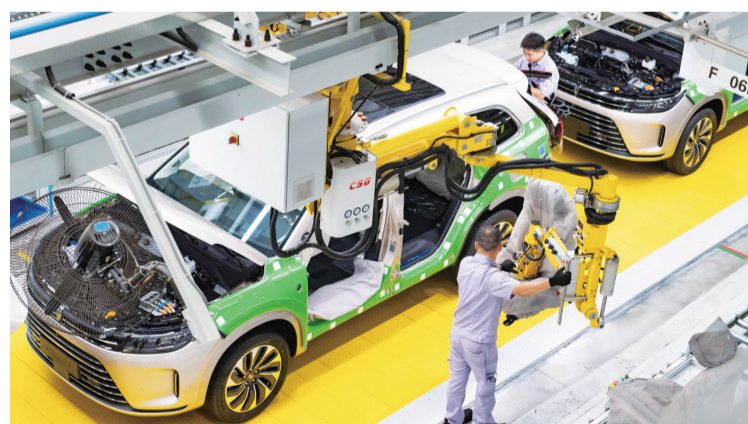
推动汽车产业转型升级,助力重庆打造“智造重镇”新名片。