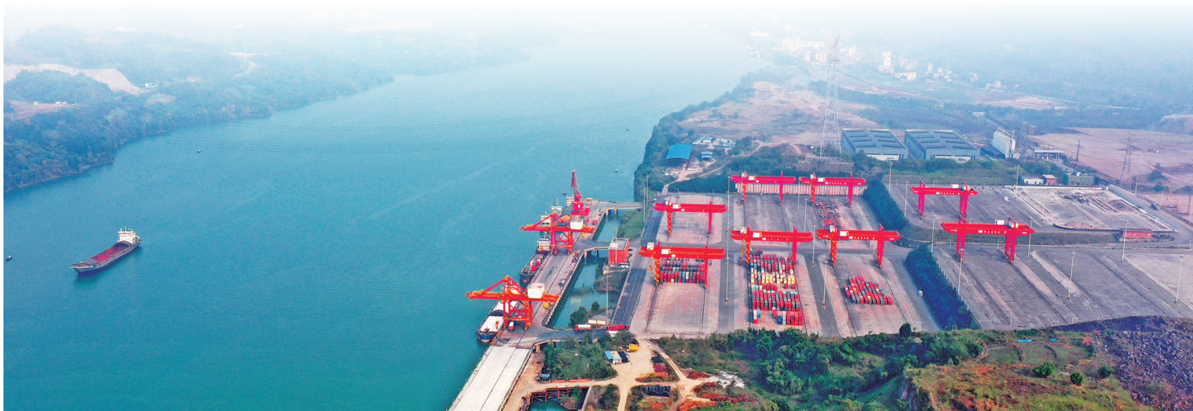
支持龙头港作业区二期工程建设,助力重庆打造内陆开放高地、国际性综合交通枢纽。

国务院决策部署,认真履行服务国家重大区域发展战略的职责和使命,立足基础设施银行职能定位,充分发挥融资融智综合服务优势,从支持通道建设、服务经贸发展、助力产业升级、提供智库咨询等多方面支持西部陆海新通道建设,助力放大“通道带物流、物流带经贸、经贸带产业”的联动效应。截至目前,该行已累计为西部陆海新通道建设投放资金超560亿元。