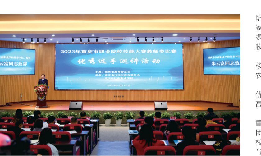
学校承办重庆市职业院校技能大赛教师类比赛巡讲活动