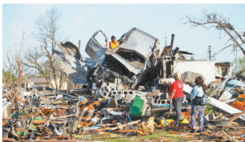
3月25日,在美国密西西比州罗克福镇,当地居民在废墟中搜寻可用物品。密西西比州24日晚遭龙卷风袭击,截至25日上午,已有至少23人确认死亡。