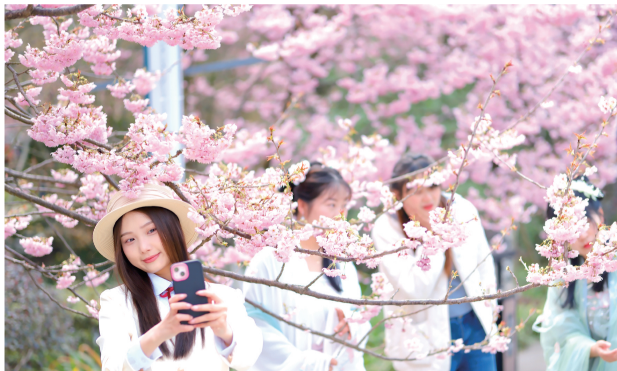
▲春意盎然，樱花盛开，吸引不少市民去南山植物园拍春天

2023重马国际消费节结合重庆国际马拉松赛事消费特点，聚焦南岸区富有特色的消费目的地，包括南滨路沿线、南山火锅一条街、南坪商圈等具有代表性的新消费场景，期间南岸区餐饮行业推出“重马火锅马”“马拉松消费直播秀”等多个创新消费场景和促销活动；商业体开展29场“春趣南岸·花样消费”主题活动；同步还推出重马国际消费节全民美拍摄影比赛，用生动的影像和视觉冲击力展现重马赛事和春季消费盛况；同期还有市民置换新能源汽车及购买绿色智能家电还能获得相应市级消费补贴，持续到月底……以吃为引，以住为媒，以购为乐，集吃、住、购、游于一体的“烟火南岸”特色商业消费IP深受广大市民欢迎，全面提升了南岸区在全市乃至全国的商业影响力、美誉度和新活力。