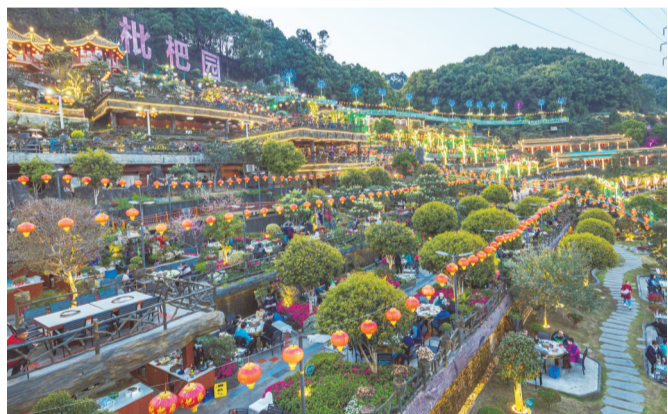
▲在南山上，吃火锅，看夜景