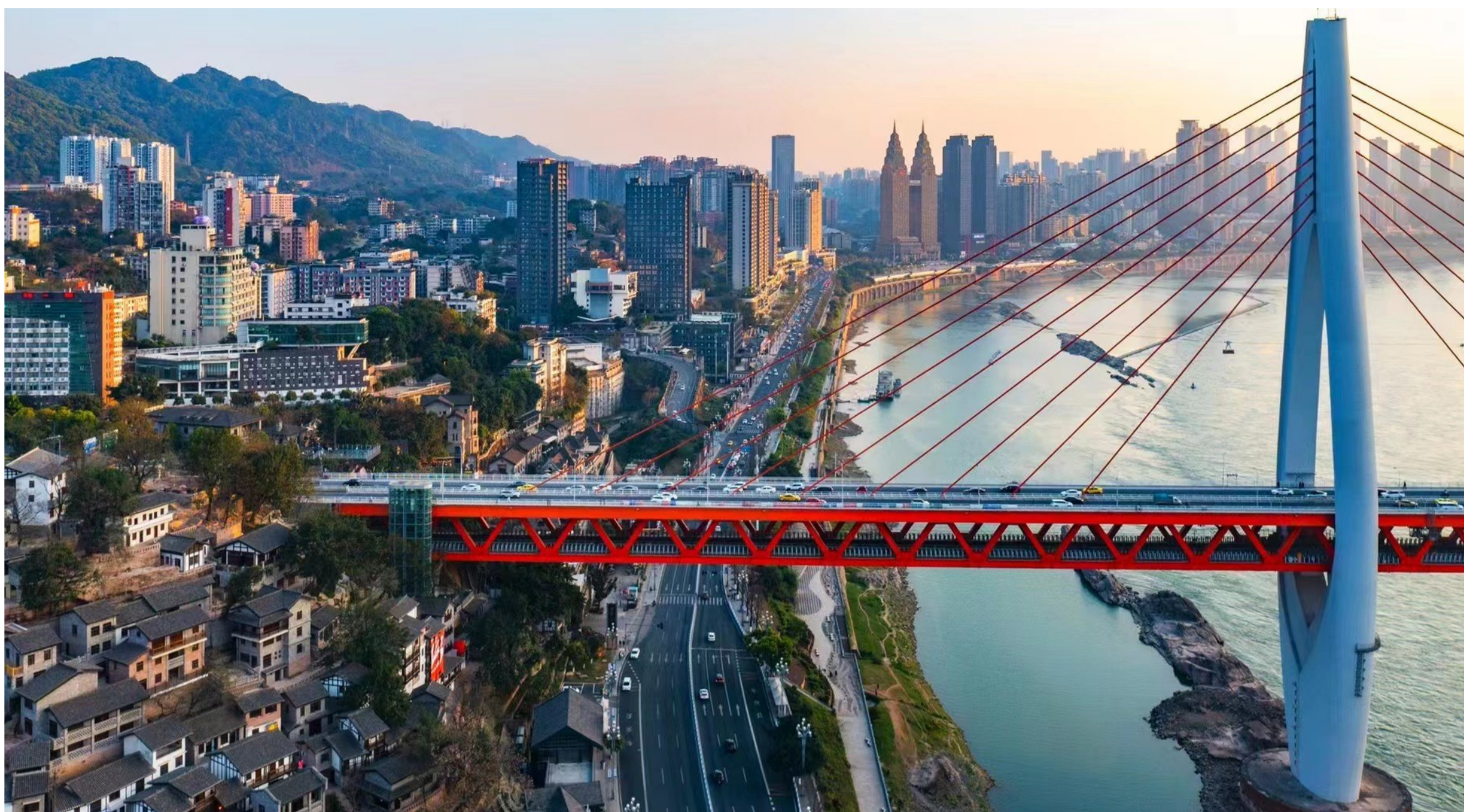
江桥相映，为南岸平添意趣