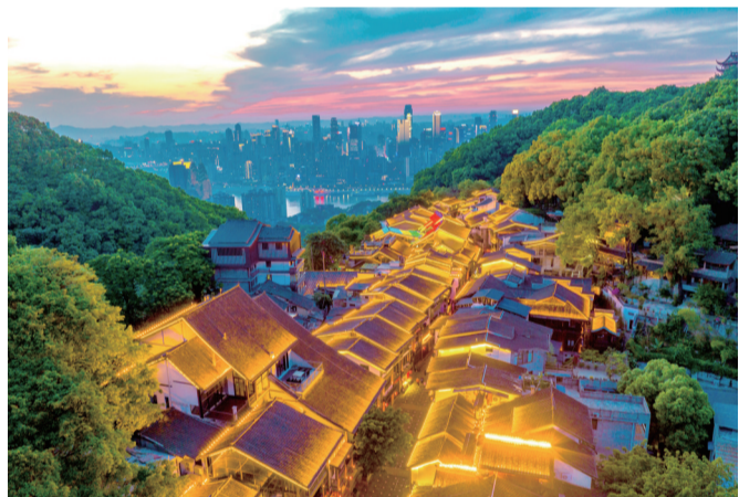
▼千年古道化身空中夜市，南山黄桷垭老街灯火通明