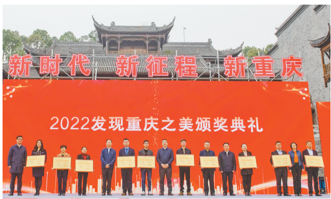
3月19日，在重庆园博园举行的2022“发现重庆之美”颁奖典礼上，获奖代表正在领奖。

本报讯（记者 崔曜）3月19日，2023年“3·19”城市管理服务主题周启动仪式暨2022“发现重庆之美”颁奖典礼在重庆园博园举行，揭晓了“重庆最美环卫工人”“重庆最美城市管理人”等8个奖项。