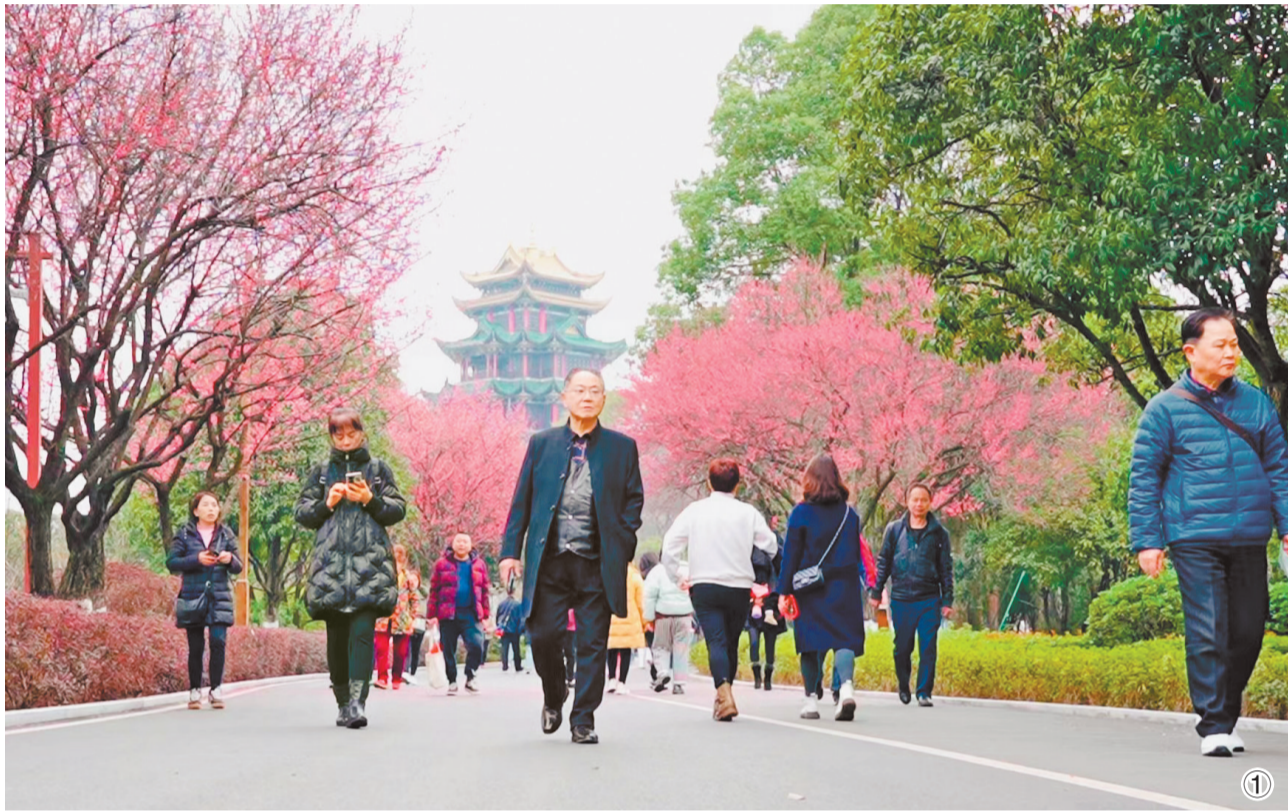
图1：江北区鸿顶路获评“重庆最美山城绿道”。

当天，2023年“3·19”城市管理服务主题周也同步启动。主题周期间，市城市管理局将开展垃圾分类新时尚推广宣传、城市管理志愿服务等系列活动。