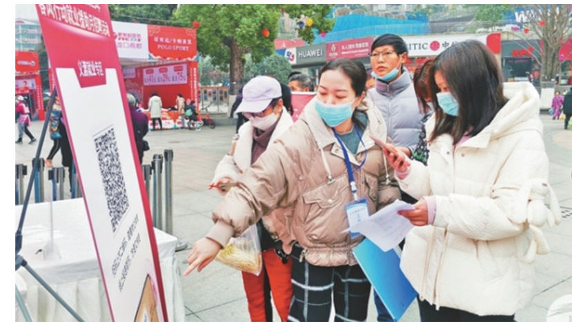
大渡口区2023年春风行动招聘会现场