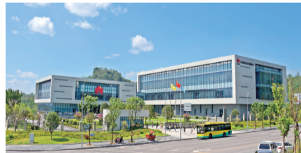
涪陵华为云计算数据中心