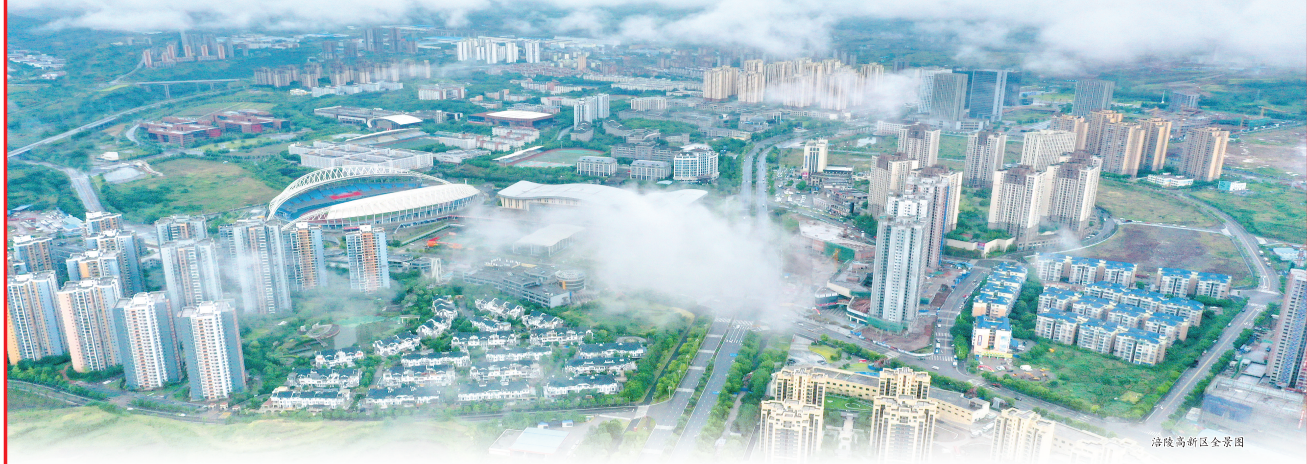
涪陵高新区全景图

涪陵高新区是我市中心城区外首个千亿级产业园区，也是涪陵工业发展的“主战场”和科技创新的“主引擎”。2022年实现规上工业总产值1225亿元，规上工业增加值370亿元，固定资产投资110亿元。涪陵高新区立足“高”“新”两篇大文章，坚持“科创+”“绿色+”，全力打造支撑涪陵“彰显‘三个重要’的百万人口战略支点城市”的重要载体，奋力建成现代宜居科创城。