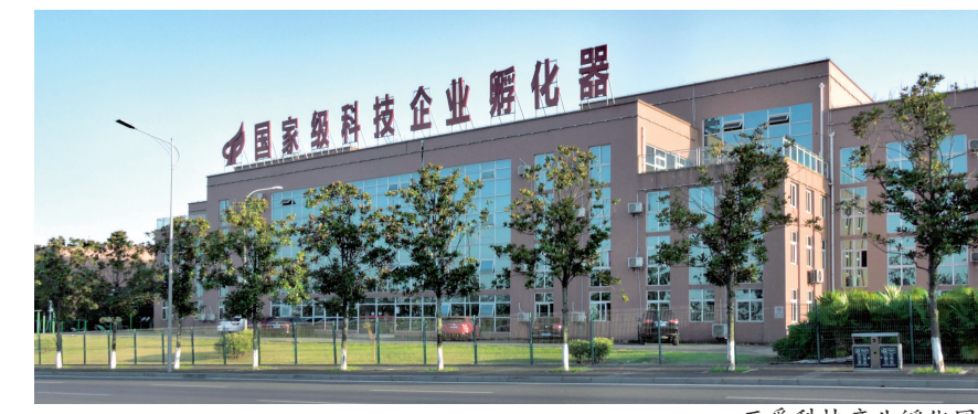
互爱科技产业孵化园