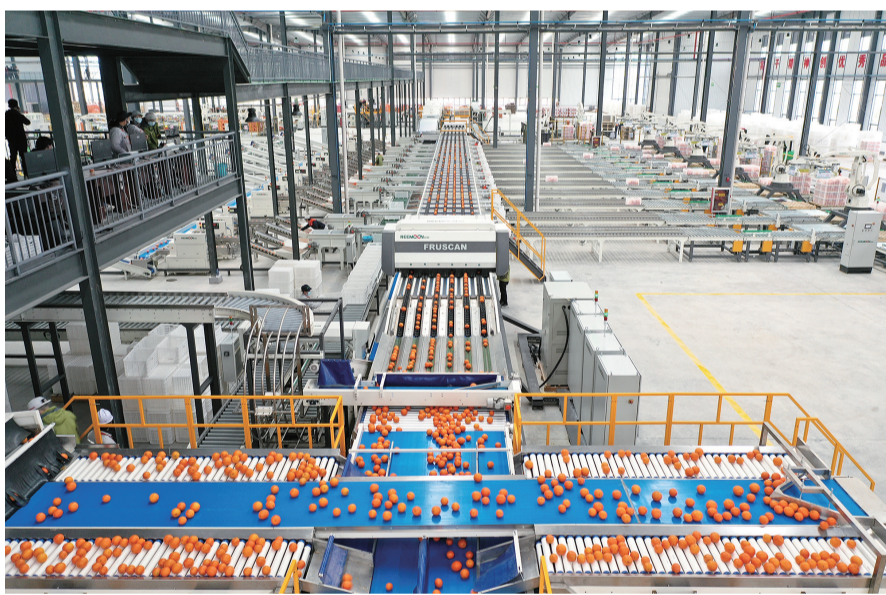
智能分选集散中心

产业融合之路越走越宽。这里农产品加工转化率达95%，农产品加工业产值与农业总产值比值为3.08:1；推出橙旅精品旅游线路12条，脐橙采摘基地面积达2万亩，脐橙线上销售量提至16%。