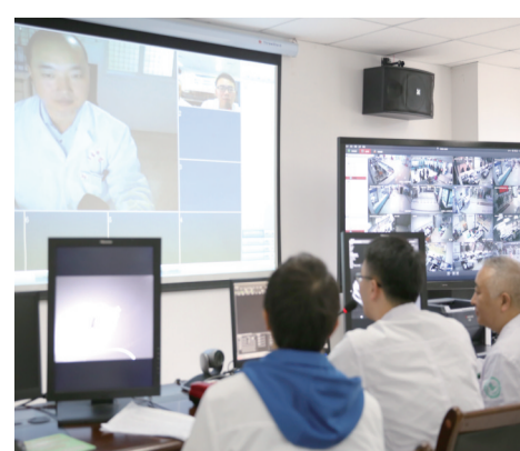
荣昌区远程(诊断)会诊中心

全面提升卫生健康领域核心竞争力，更好满足人民日益增长的健康需求，既是荣昌区卫生健康工作的使命与担当，也是全面推动卫生健康事业高质量发展的决心与勇气。