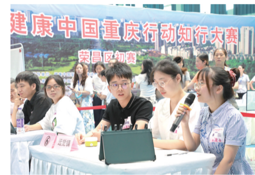
健康中国重庆行动知行大赛荣昌初赛

锻造更强实力，开启广阔未来。立足把荣昌打造为渝西川南卫生健康高地，荣昌正朝着“2025年区域内就诊率达95%以上，基层医疗卫生机构诊疗人次占比达65%以上，城乡居民健康素养水平达30%，人均预期寿命达到79.3岁”的卫生健康现代化之路行稳致远。