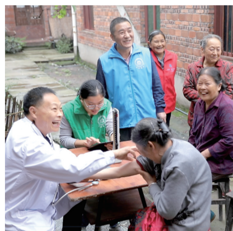
家庭医生团队为慢病患者开展分层分级“五色”健康管理服务

“这个病如果到中心城区治疗，我们来回奔波不方便。现在荣昌能得到良好治疗，真是太好了！”