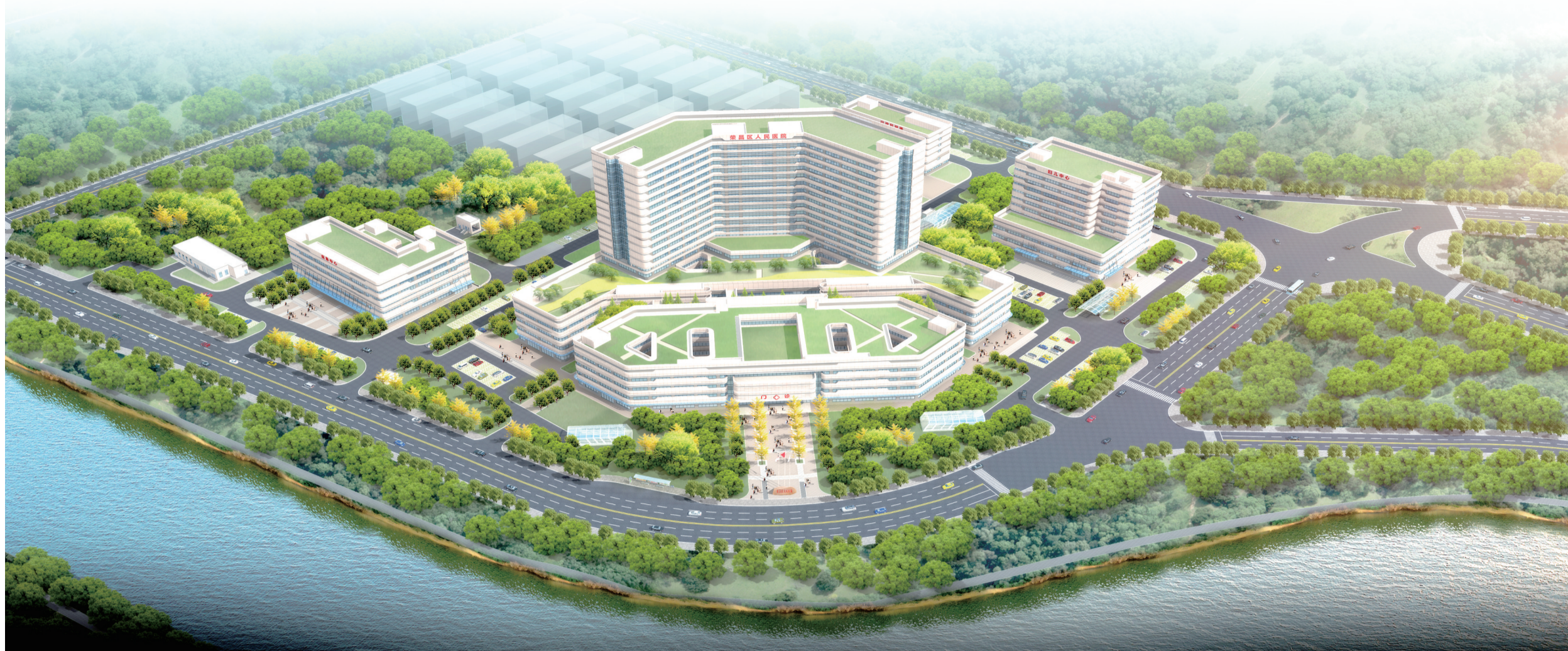
荣昌区人民医院规划效果图