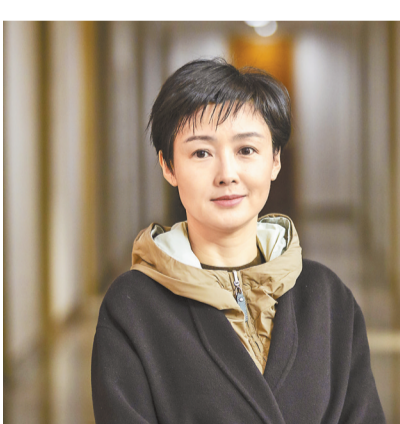
全国政协委员高琳。

□本报记者 何春阳 每逢节假日，渝中区的戴家巷、山城巷、十八梯等景点总是游人如织。经过近年来的改造修缮，它们已经成为重庆的一张名片。“我一直很关注城市更新过程中历史文化资源保护利用的问题。”2月22日下午，全国政协委员、渝中区副区长高琳在接受重庆日报记者采访时表示，要保护和利用好历史文化资源，让城市留住记忆，让人们记住乡愁。高琳说，我国在城市演变发展进程中形成了丰富的历史文化街区资源，真实记录了城市发展变迁，是千年来城市文化展示的重要窗口。截至2022年，全国划定历史文化街区已超1200片。“近年来，全国各省市在推动历史文化街区保护工作上做了不少工作。”高琳介绍，比如强化普查认定、系统安排历史文化保护工作、加强修复修缮等。由于当前历史文化保护实践主要依托认定的历史街区和历史文化街区，这会促使各地对历史文化资源富集的片区加大保护和利用的力度，让这些不可再生的珍贵资源，以另外一种方式活在当下。渝中区是重庆母城，多处建筑历史悠久，其城市更新进度也走在全国前列，2021年，渝中区入选全国第一批城市更新试点城市。近年来，渝中区顺应城市肌理，精品打造中山四路等3个历史文化街区、十八梯等9个传统风貌区、三层马路等7个山城老街区，精心实施149处文物、44处历史建筑保护修缮。此前，高琳也曾围绕重庆两江四岸核