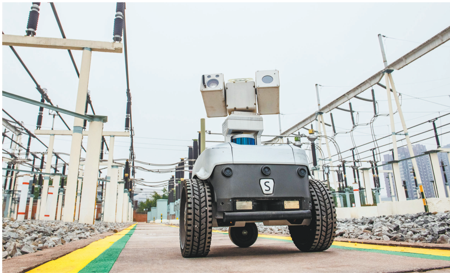
▲一月二十二日,大竹林变电站,巡检机器人正在例行巡视、表计抄录和测温。

《方案》提到,到2025年,重庆机器人产业销售收入将突破800亿元,机器人在工业生产各领域的应用取得重大进展,形成一批具有共生、互生、再生、富有活力和可持续发展的机器人产业新业态,建成国内一流的机器人应用示范基地和产业创新发展示范区。