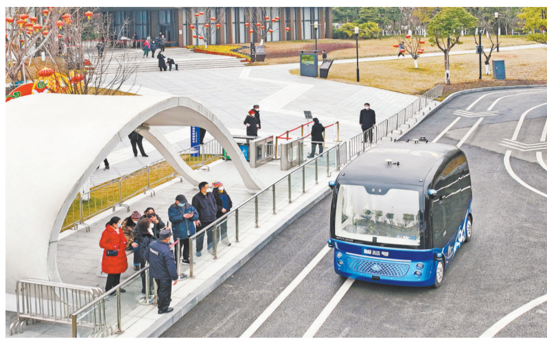
▲1月24日,礼嘉智慧公园,无人驾驶接驳车正在起点站载客。