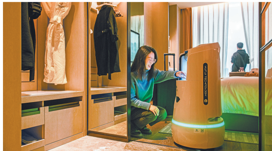
▲1月23日,嘉泊汀酒店,住客从机器人“送物小可爱”的“肚子”里取到饮用水。