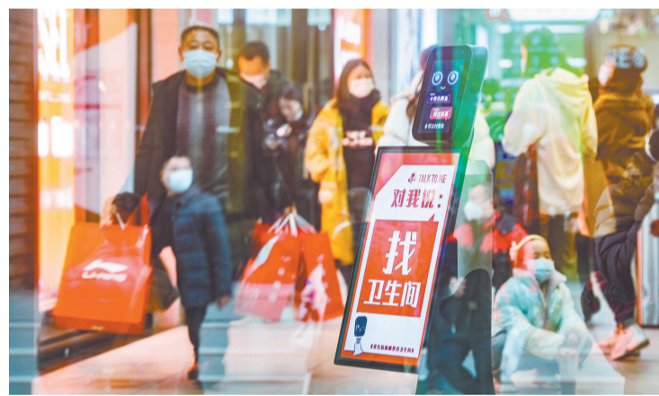
▲1月23日,寸滩国际新城时尚消费区,机器人“店小二”正提示消费者如何和自己对话。