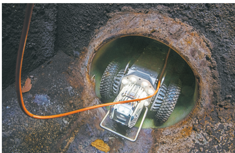
▲1月21日,两江新区黄杨路,两江新区市政园林水利管护中心的管道机器人正在雨水井内检查管道内壁结构。