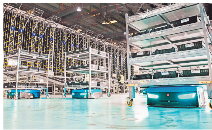
▲1月21日,两路寸滩综合保税区的一座大型自动化立体仓库内,智能搬运机器人正在往返运输物件。