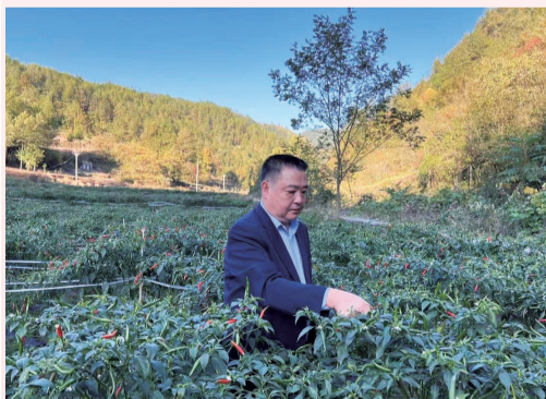
奉节支行工作人员走访某农业科技公司发展并为其提供金融服务

党的二十大报告把“建设现代化产业体系”列入我国加快构建新发展格局，着力推动高质量发展的重要内容。随着“智造重镇”轮廓初显，工行重庆市分行支持我市现代产业体系构建也不断取得新突破。围绕建设“国家重要先进制造业中心”，制定实施制造业金融服务专项行动方案，助力“制造强市”建设。截至2022年末，制造业贷款新增270多亿元，支持了4735家制造业企业。围绕战略性新兴产业发展，累计为250多家企业发放贷款。围绕现代服务业发展，学校医院设备购置贷款投放额领先同业，并实现我市首笔体育领域再贷款PPP项目突破。