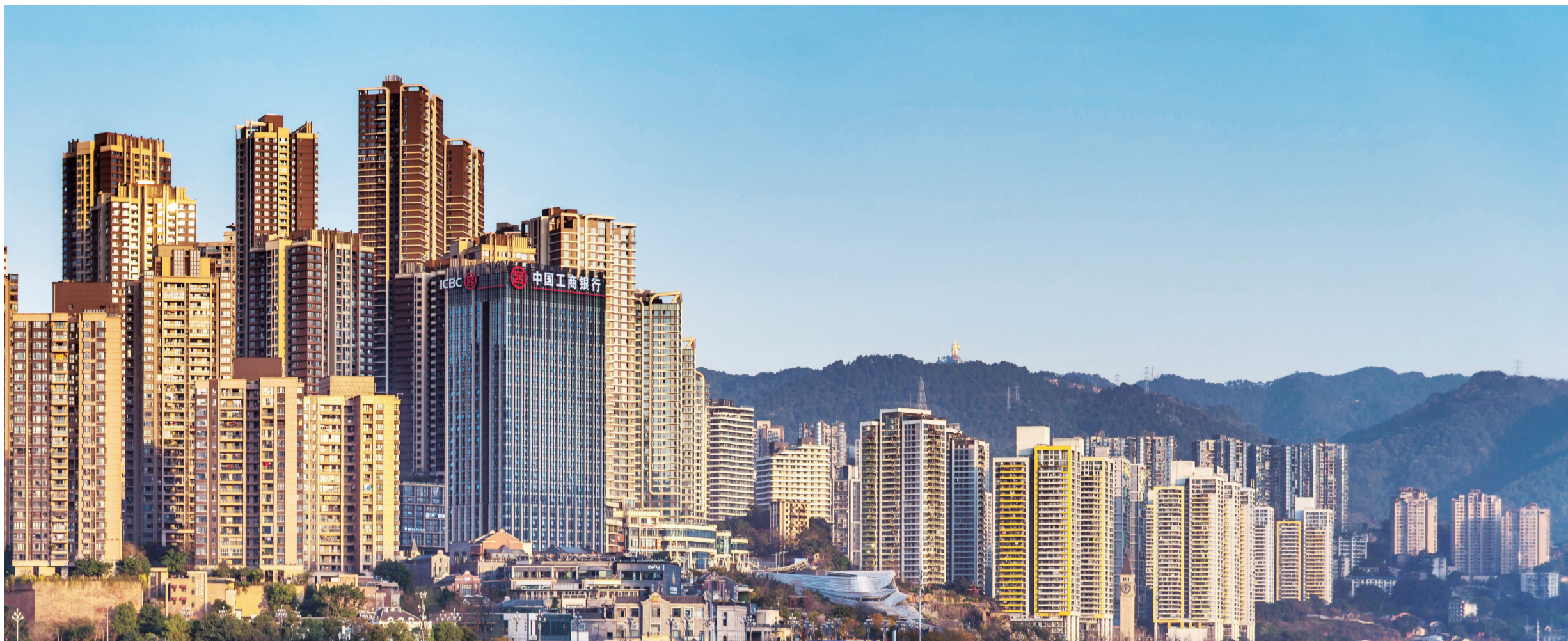
为现代化新重庆建设贡献工行力量