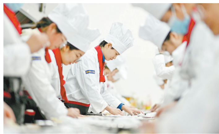
重庆商务职业学院学生在上岗点实训课。重庆将着力探索职业教育体系建设新模式,大力培养技能人才。