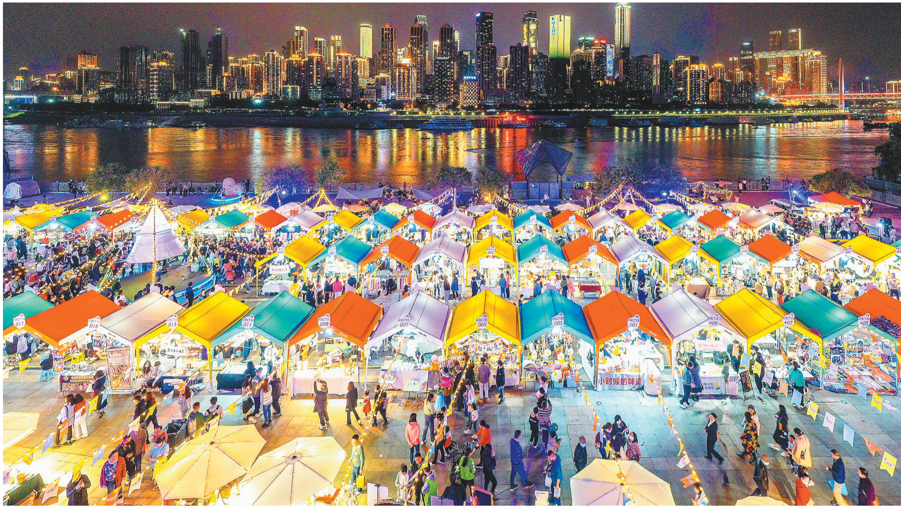
南滨路“彩虹集市”上,前来消费的市民数量众多。聚焦创业创新扩增量,重庆市着力培育夜间经济,取得了明显的成效。