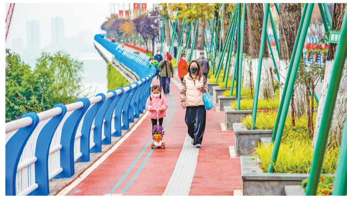
九滨路上,市民在人行道上休闲散步。近年来,九龙坡区对一批主要道路的人行道实施“畅通、安全、舒适、美化”工程,大幅改善了市民的出行环境。