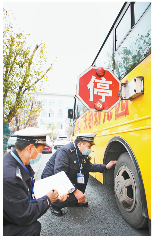
2月1日,永川区车管所,民警在检查校车轮胎。

随着新学期开学日子临近,目前,我市各地正积极开展中小学及幼儿园新学期教材和教辅材料准备、校园设施设备管护、校车安全隐患排查等工作,为新学期开学做好准备。