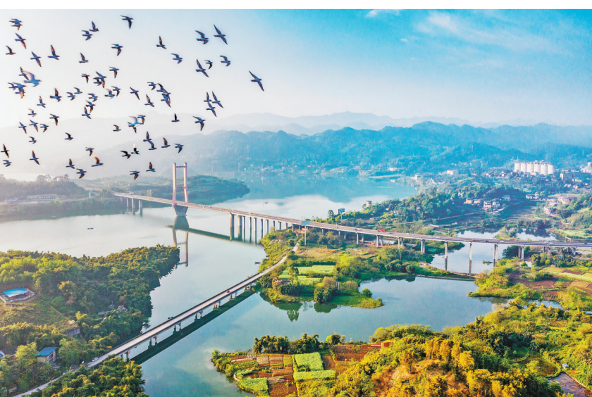
合川三江国家湿地公园。

在当天的活动中,主办方还通过线下展板展示、发放宣传资料及文创产品、线上开展互动小游戏、扫码答题抢红包等形式,向民众普及湿地保护法相关知识,介绍湿地的多种效益和功能。