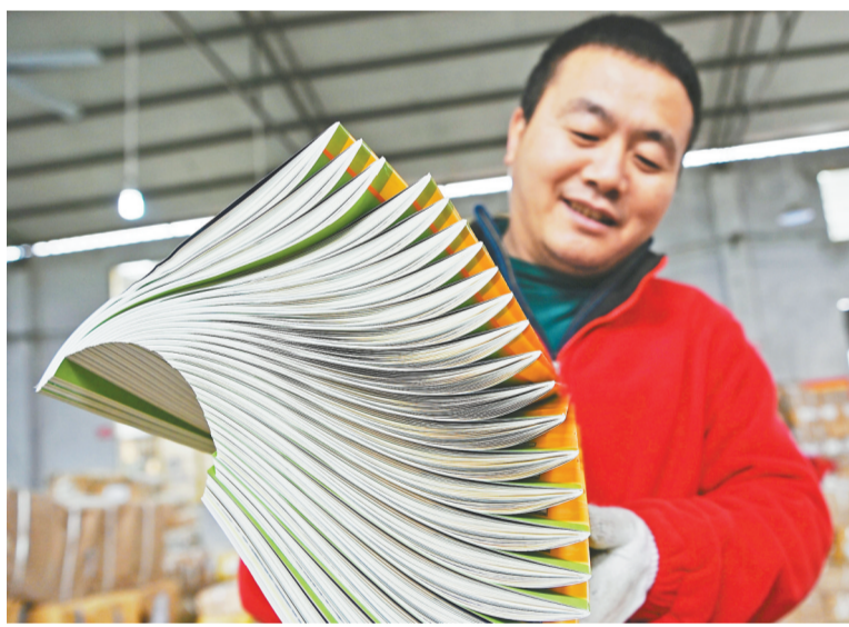
2月2日,巴南区融汇小学,工作人员在对新学期的教材和教辅材料进行接收、清点、分发工作,确保教材按时到位,为新学期开学做好准备。