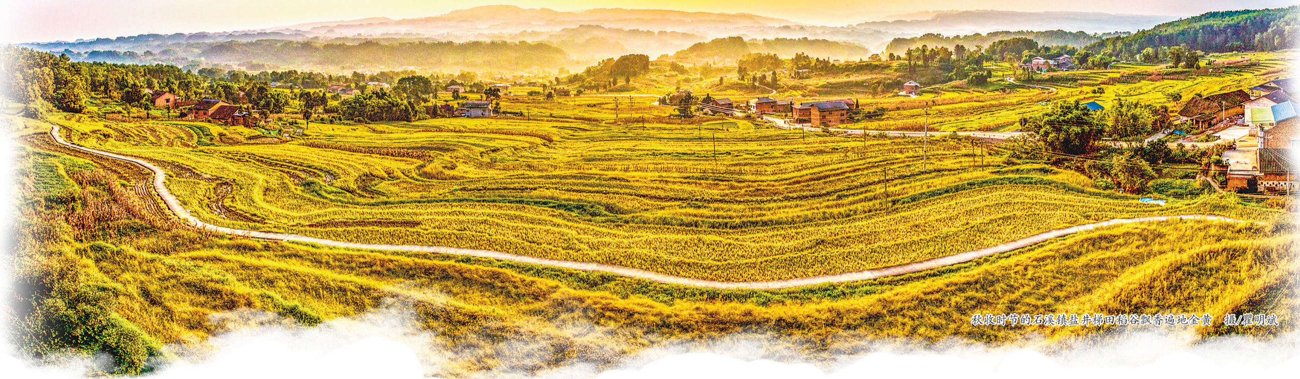
秋收时节的石溪镇盐井梯田稻谷飘香遍地金黄