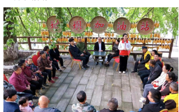
坝坝加油站走进乡村

近年来，该区将文明实践活动的触角延伸到农家院坝，创新在农家院坝、村社广场等群众“家门口”建设“坝坝加油站”2600余个，牢筑精神文明“新阵地”。去年，开展党的二十大主题微宣讲、文明直通车等活动1.4万余场次。