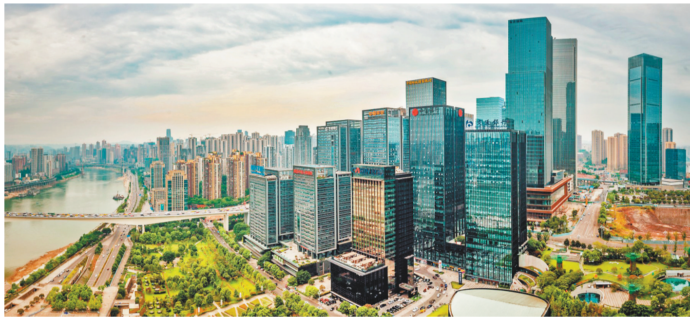
图为江北嘴金融核心区。

面积、人流量、销售额“三个翻番”,深入落实扩大内需战略,大力实施“巴渝新消费”八大行动,创新消费场景,构建“一核多点”商贸格局,打造江北嘴国际高端购物目的地、北滨路国际“慢生活”经济带、寸滩国际消费新地标、果园港国际物流枢纽等更多支撑点;顺应消费升级趋势,发展总部经济、夜间经济、“四首”经济,加快引进香奈儿、米其林餐厅等高端业态,打造西部地区最大的高端酒店集群,进一步提升传统消费、培育新型消费、扩大服务消费等。