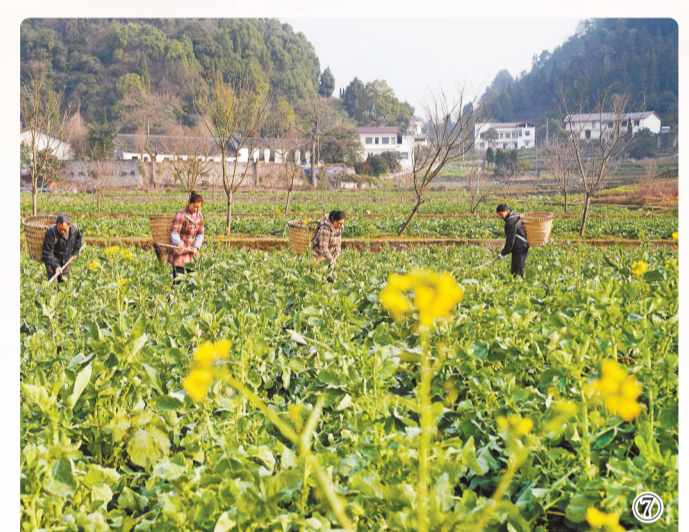
图①1月28日,渝湘高铁重庆段隧道院子隧道内正在施工。图②1月28日,巫镇高速公路巫溪段施工现场,一派繁忙景象。图③1月28日,重庆果园港,集装箱整齐有序地摆放在港口等待吊装。图④1月28日,两江新区平伟汽车科技股份有限公司生产车间,工作人员在车间内忙碌。图⑤1月28日,垫江县三峰新能源发电有限公司,工作人员正在作业。图⑥1月28日,南岸区,中国信息通信研究院西部分院“微波暗室”内,工作人员准备进行方向图测试。图⑦1月28日,北碚区天雨镇代家村,村民在地里除草。