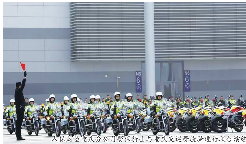
人保财险重庆分公司警保骑士与重庆交巡警队进行联合演练

公司积极响应国家金融服务制造业的决策部署，创新保险产品和服务，提升制造业企业风险保障水平。