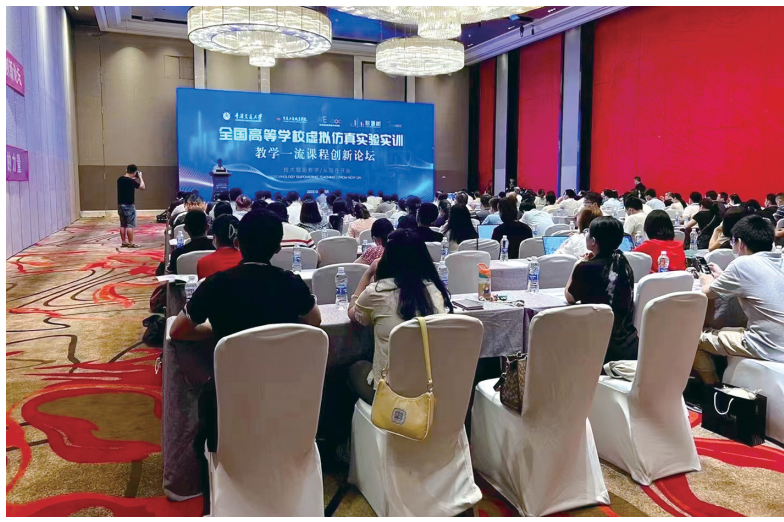
重庆交通大学举办全国高等学校虚拟仿真实验实践教学一流课程创新论坛

“我们不断健全完善教务党支部的组织体系、制度体系和工作机制,全面加强和改进党的建设,以党建高质量促进人才培养高质量,为发展一流高等教育提供坚强的政