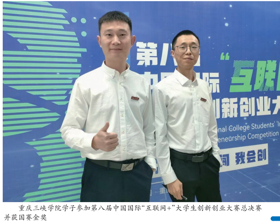
重庆三峡学院学子参加第八届中国国际“互联网+”大学生创新创业大赛总决赛并获国赛金奖