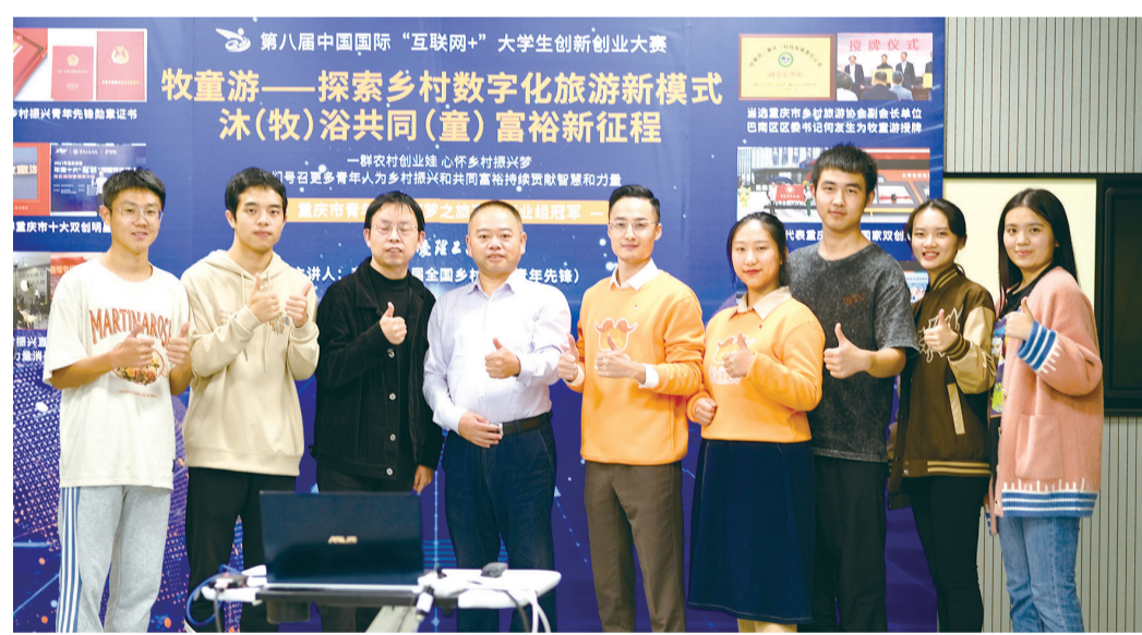
重庆理工大学参加第八届中国国际“互联网+”大学生创新创业大赛

3年时间，带领团队运用“牧童游”平台，服务B端掌柜客户4000多家，C端用户100多万人次，携手经营者打造上百家居旅游基地，让乡村旅游经营者拥有属于自己的互联网阵地，“牧童游”也因此成为“中国最具品牌影响力项目”称号。