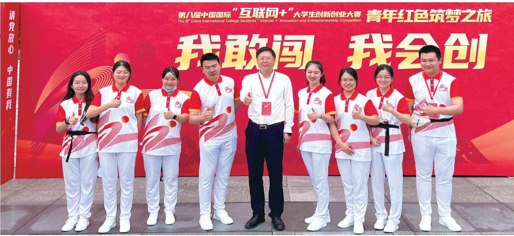
青年学生参加创新创业教育活动尽显朝气与活力

2022年，我市高校获批4个国家级创新创业学院和创新创业教育实践基地；承办第八届中国国际“互联网+”大学生创新创业大赛，我市10所高校共获27个金奖、重庆大学以13个金奖位居全国高校第一，入围总决赛项目金奖率54.55%居全国第一；《重庆市“四个强化”深化创新创业教育改革》经验在全国推广……这份亮眼的成绩单，正是我市持续深化创新创业教育改革的缩影。