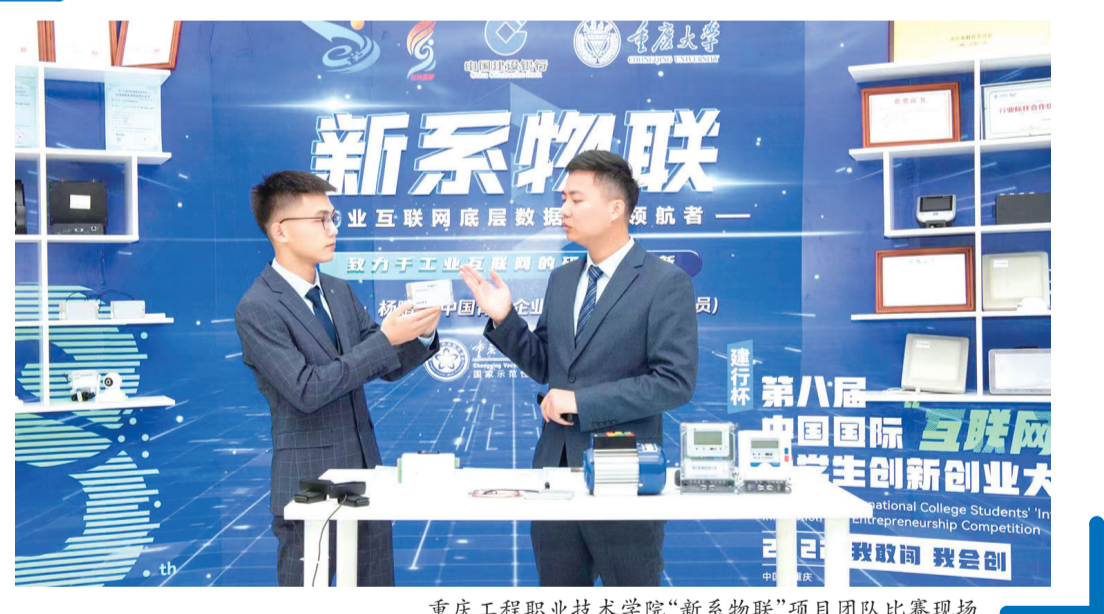
重庆工程职业技术学院“新系物联”项目团队比赛现场

近年来，学校先后获得“互联网+”、挑战杯等省部级以上创新创业大赛奖励100余项，是全国唯一一所连续两次荣获团队中央“践行工匠精神先进个人”特别奖的高校。