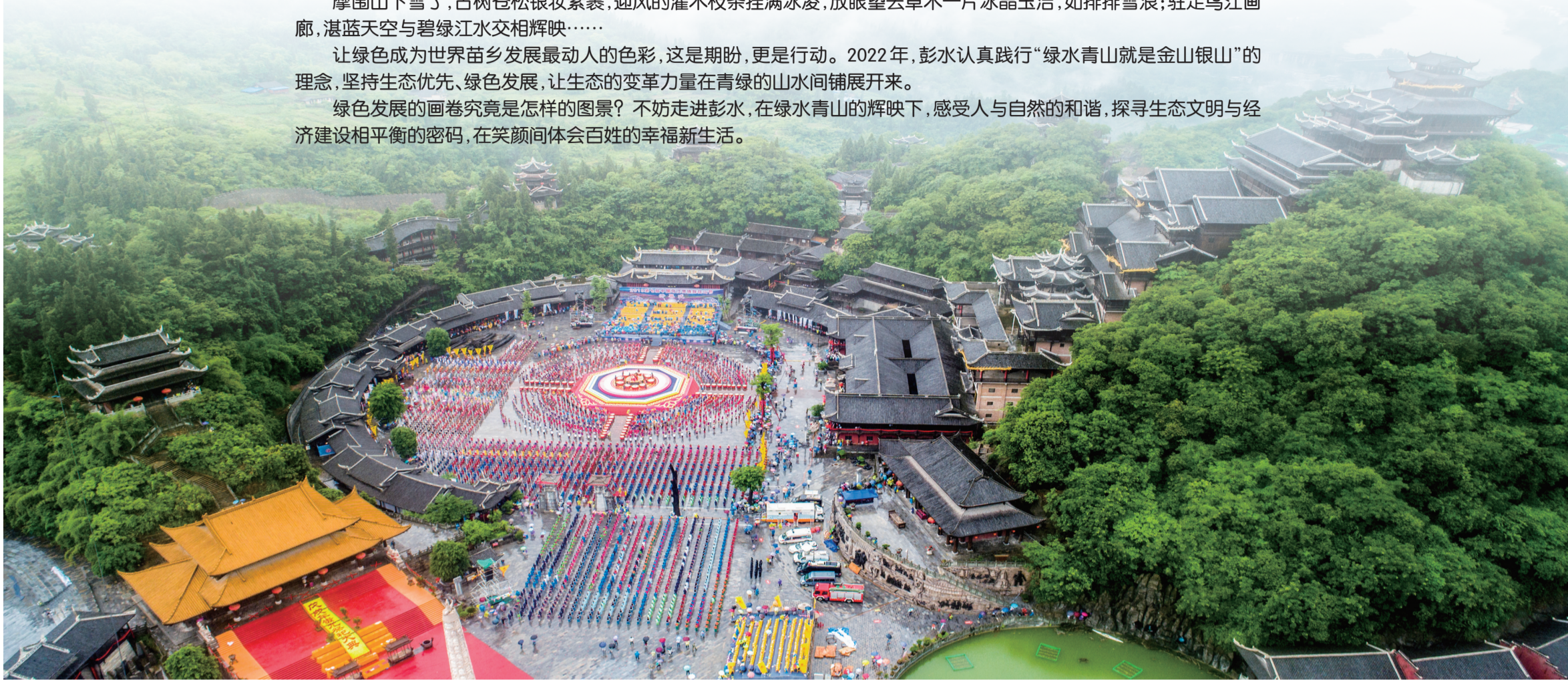
蚩尤九黎城举办万人踩花山节

隆冬时节，彭水亦美。摩围山下雪了，古树苍松银妆素裹，迎风的灌木枝条挂满冰凌，放眼望去草木一片冰晶玉洁，如排排雪浪；驻足乌江画廊，湛蓝天空与碧绿江水交相辉映…… 让绿色成为世界苗乡发展最动人的色彩，这是期盼，更是行动。2022年，彭水认真践行“绿水青山就是金山银山”的理念，坚持生态优先、绿色发展，让生态的变革力量在青绿的山水间铺展开来。 绿色发展的画卷究竟是怎样的图景？不妨走进彭水，在绿水青山的辉映下，感受人与自然的和谐，探寻生态文明与经济建设相平衡的密码，在笑颜间体会百姓的幸福新生活。