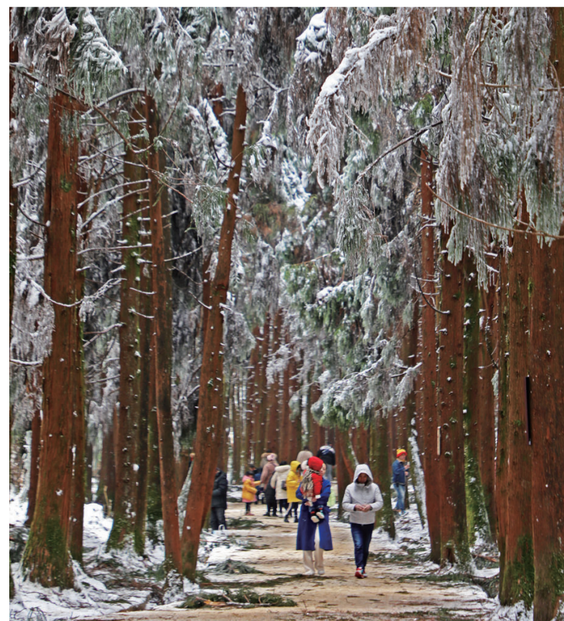
游客在摩围山赏雪

彭水聚焦现代山地特色高效农业，大力发展以烤烟、红薯、中药材、茶叶、商品蔬菜、生猪、中蜂等特色产