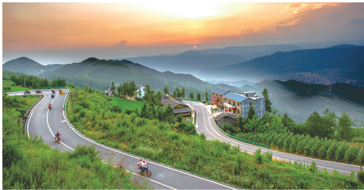
汉丰街道南元村旅游路