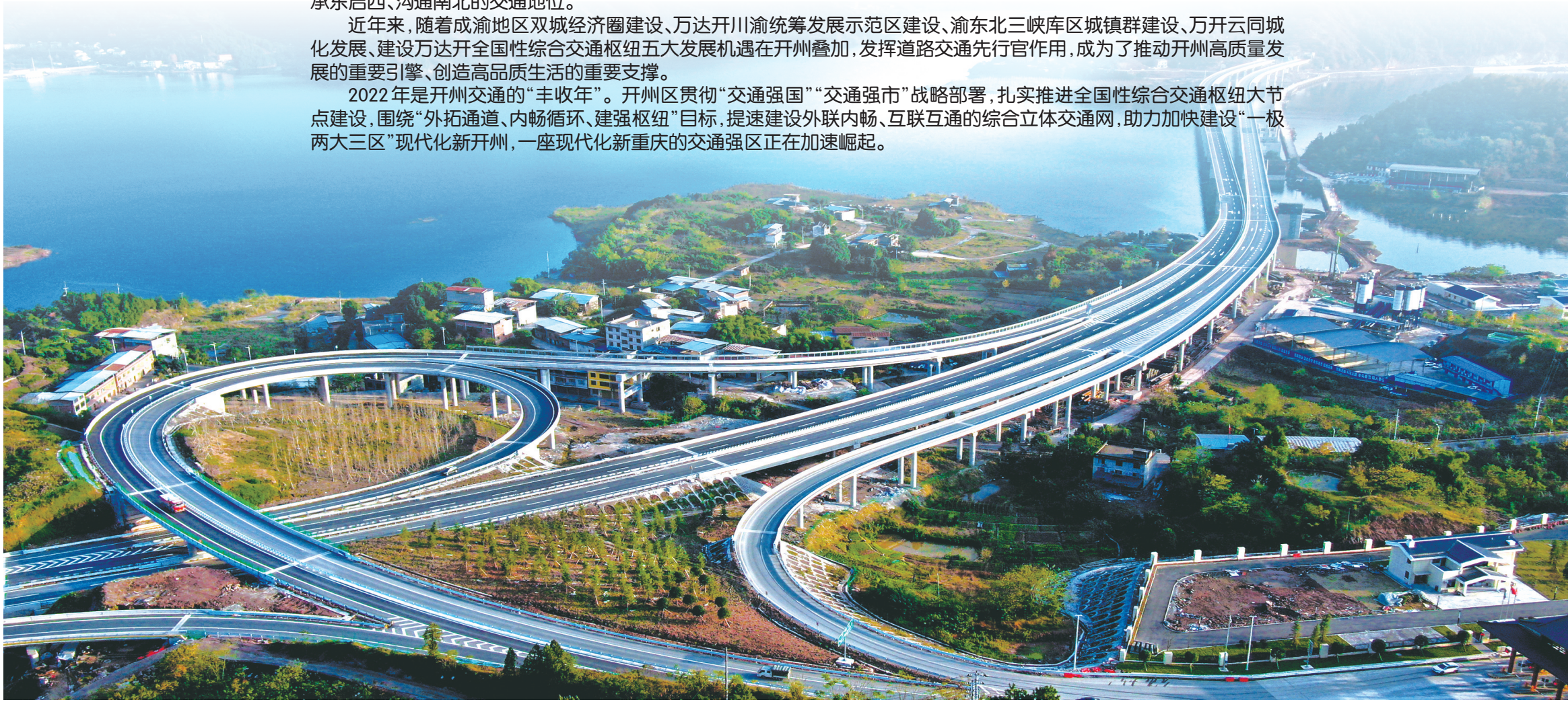
开城高速东互通枢纽

2022年是开州交通的“丰收年”。开州区贯彻“交通强国”“交通强市”战略部署，扎实推进全国性综合交通枢纽大节点建设，围绕“外拓通道、内畅循环、建强枢纽”目标，提速建设外联内畅、互联互通的综合立体交通网，助力加快建设“一极两大三区”现代化新开州，一座现代化新重庆的交通强区正在加速崛起。