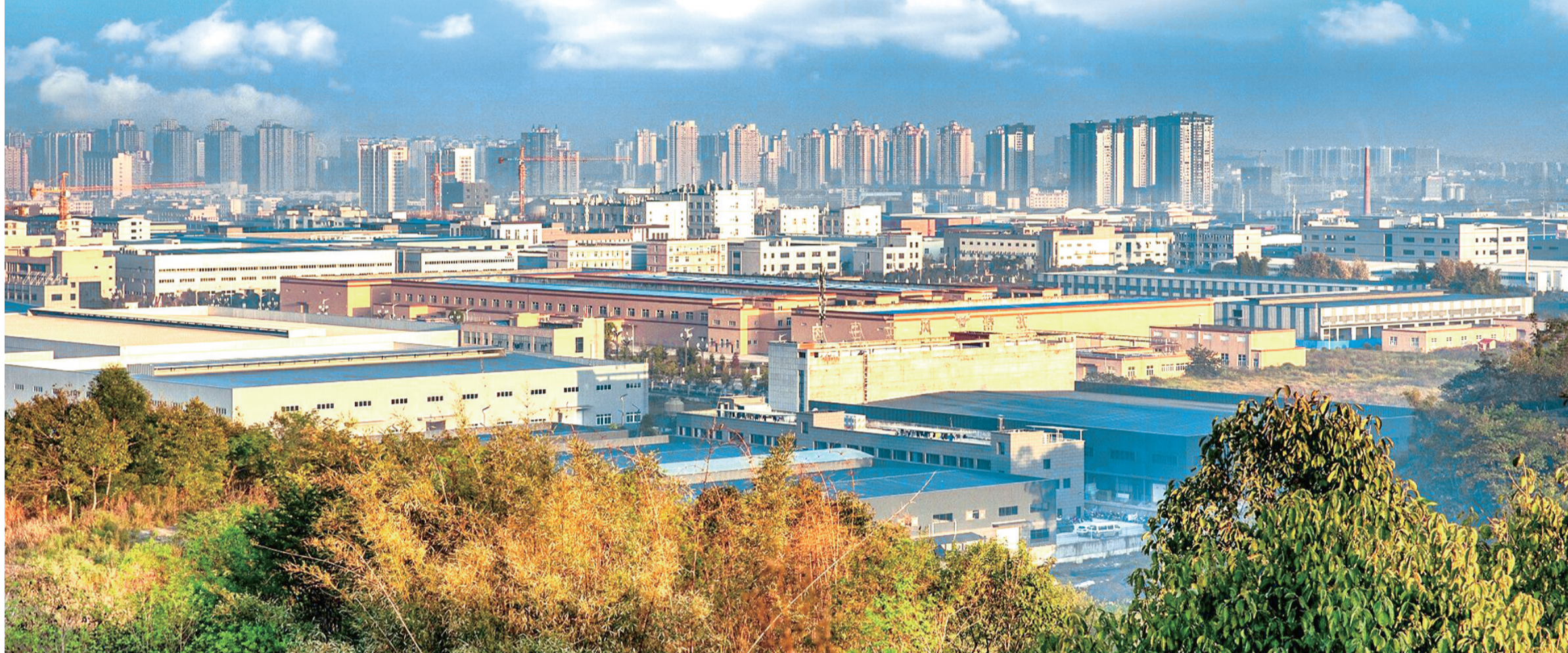
产业集聚的桥头堡