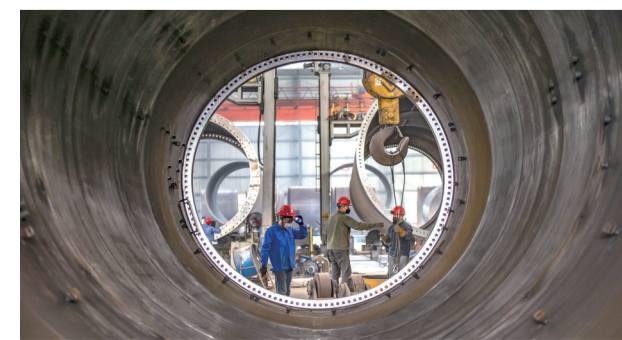
忙碌中的高新区建设者

术创新高地、生猪产业发展高地、畜牧科研人才高地。二是推动科技创新赋能产业发展,建好中国西部陶瓷之都,打造生物医药创新中心、电子电路创新中心、特种陶瓷创新中心、装备制造创新中心等一批具有全国影响力的创新平台。三是搭建创新创业人才聚集平台,支持市畜科院建设“国内一流、国际知名”畜牧科研强院,支持西南大学荣昌校区“扩容提质”1000亩、建成万人规模高校,建成重庆城市管理职业学院荣昌校区,投资40亿元建设成渝地区双城经济圈科创中心,定期举办中国畜牧科技论坛、动物环境与福利化养殖国际研讨会,打造科技资源、科技人才、科技信息聚集高地。以国家生猪技术创新中心为抓手,以市畜科院科研体制改革试点为契机,靶向引进“高精尖缺”领军人才驻荣昌、扎根荣昌。