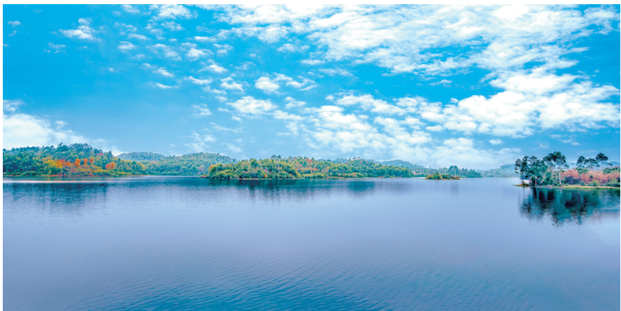
大美小北海