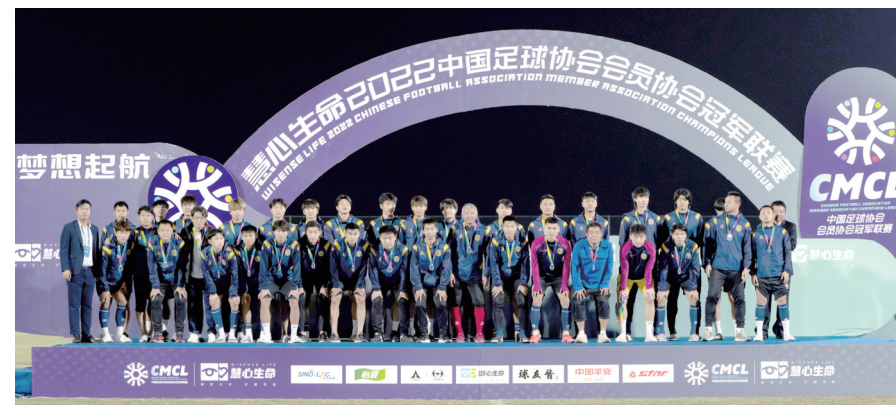
铜梁龙足球俱乐部获2022年中冠联赛亚军

新思路、新机制、新举措，有力促进了铜梁文化与旅游的激情碰撞和深度融合，带来了文旅产业发展新动能。