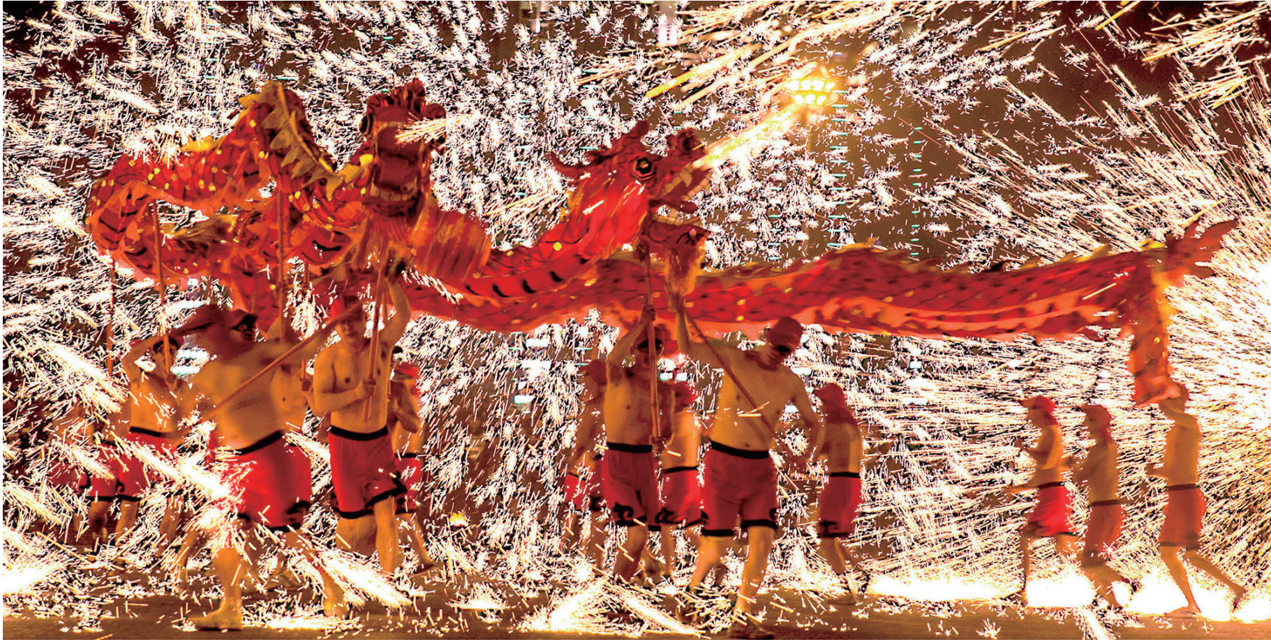
铜梁火龙

全年累计接待游客总人数达到1650万人次，同比增长10.3%；实现旅游综合收入101亿元，同比增长18.8%。“周末到铜梁”品牌越唱越响，龙文化旅游名城建设扎实推进。