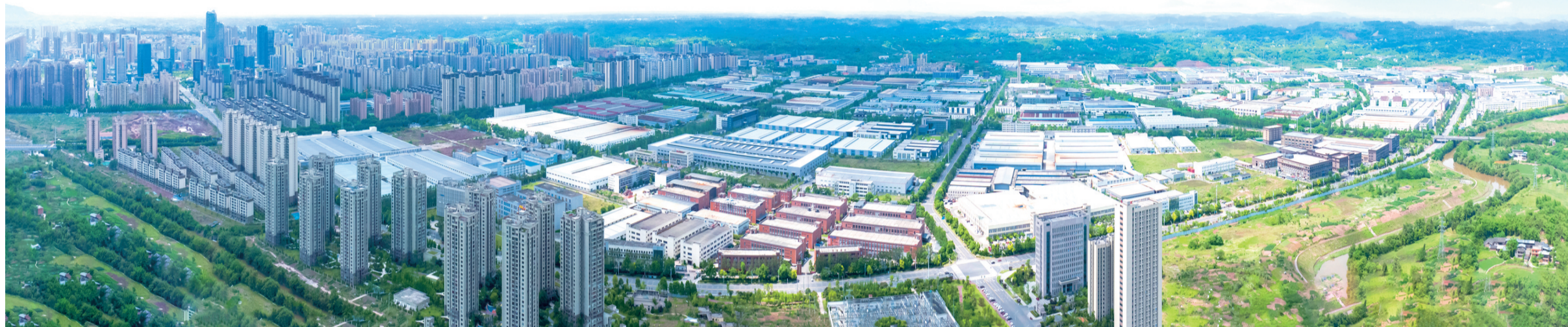
铜梁高新区

其中,投资总额超100亿元的海辰储能西南智能制造中心及研发中心(下称“海辰储能”)项目,成为落户重庆的首个锂电化学储能整装项目,创下从获取投资信息到项目签约落地仅仅48天的“铜梁速度”。