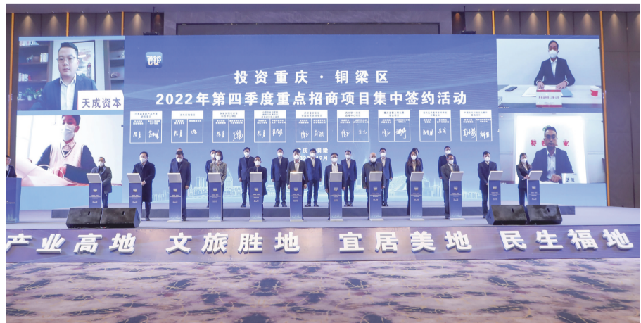
2022年第四季度重点招商项目集中签约活动