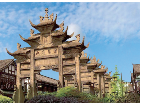
隆昌市尚关石牌坊

——线上+线下,高效服务群众。充分利用大数据、智能化手段,以电话、远程视频沟通为载体,推动线上线下融合、本地异地同步,支撑“全程网办”“多地联办”“异地代收代办”等多种办理模式,并创新实行“川渝通办”事项优先处理,让川渝营业执照互办互发等多个事项当场办结,异地办事“就近跑一次”,真正实现“让数据多跑腿,群众少跑路”。