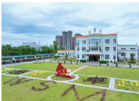
隆昌集团隆昌茶厂

——设立专窗,明确专人负责。在市政务服务大厅三楼设立“川渝通办”专窗,落实“专人”“一对一”辅导、对接。同时,建立“川渝通