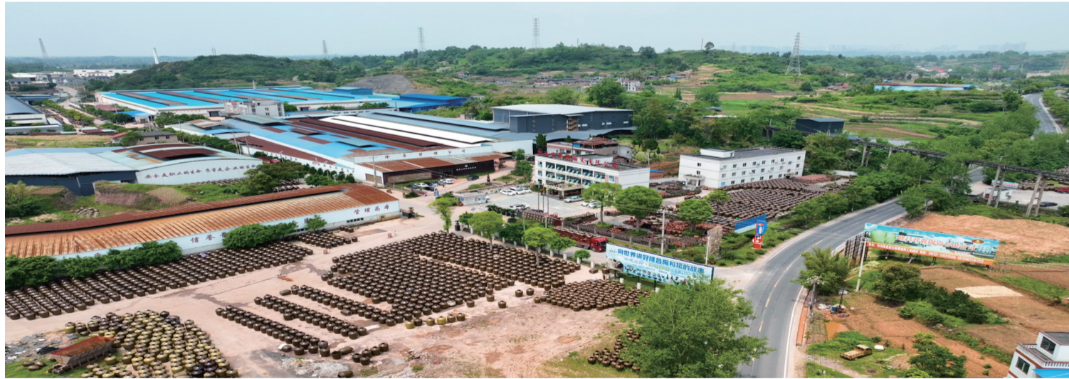
隆昌市陶瓷产业园

办”服务事项联系制度,定期开展工作规程、业务知识等专业培训,提高工作人员的办事水平及服务质量。