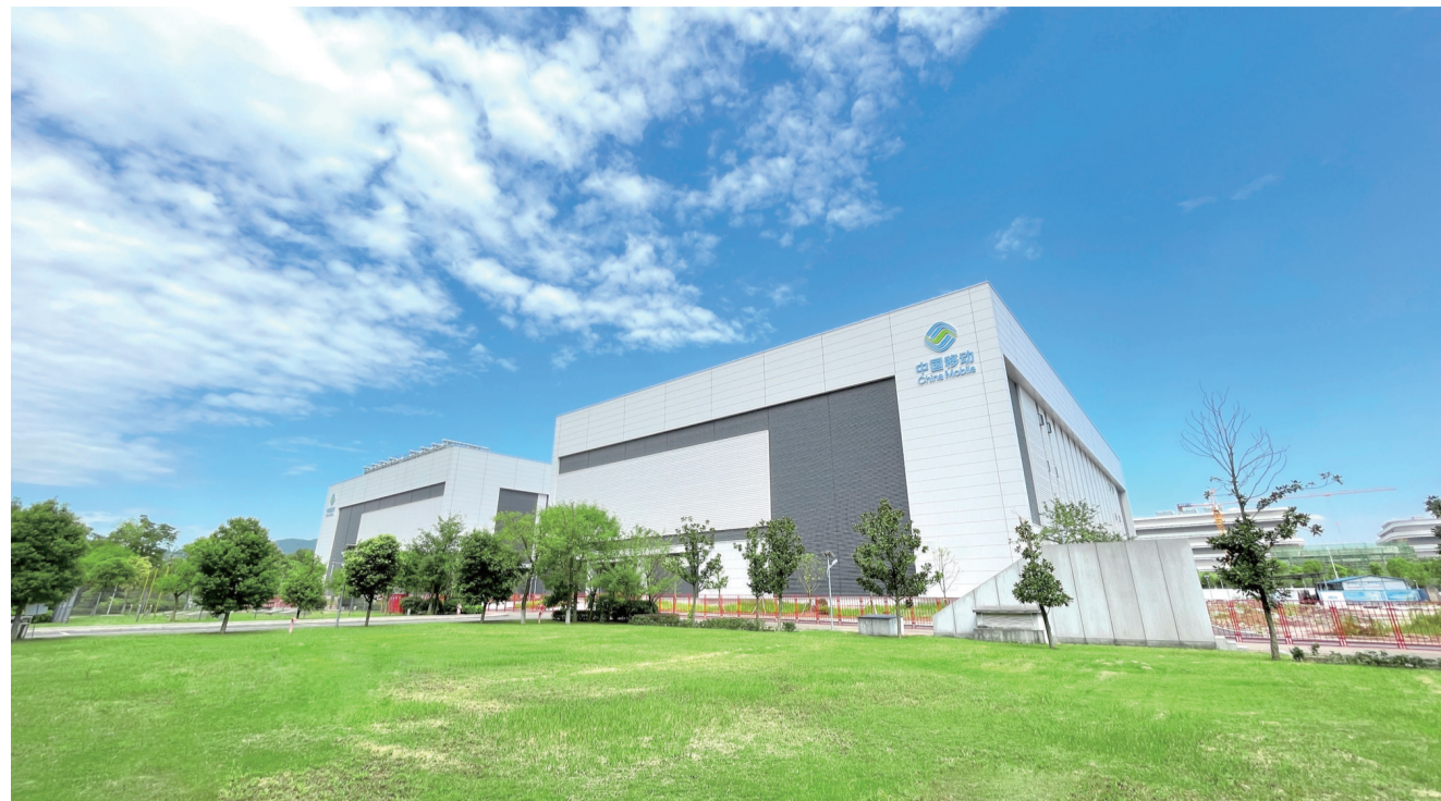
位于重庆两江新区水土新城的中国移动(重庆)数据中心

础。2022年以来，重庆移动携手兄弟单位，加快新型信息基础设施协同布局。全年新建5G基站2.6万个，实现乡镇及以上区域的连续覆盖，新建宽带用户数276万线，总规模近4600万户。新增千兆端口9.7万个，实现成渝地区城区和重点乡镇全覆盖。