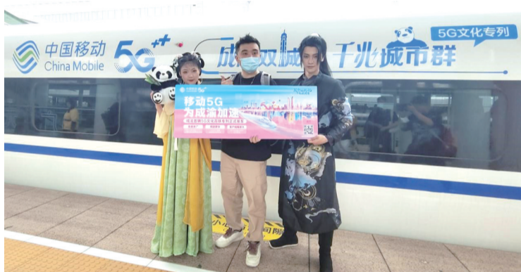
中国移动5G文化高铁专列为成渝加持