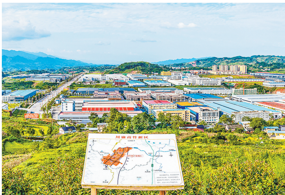
川渝高竹新区全貌图。

2021年6月29日，渝北南北大道二期工程正式通车，渝北新增了一条通往四川邻水的大通道，从两路城区到川渝高竹新区车程缩短到1小时内。