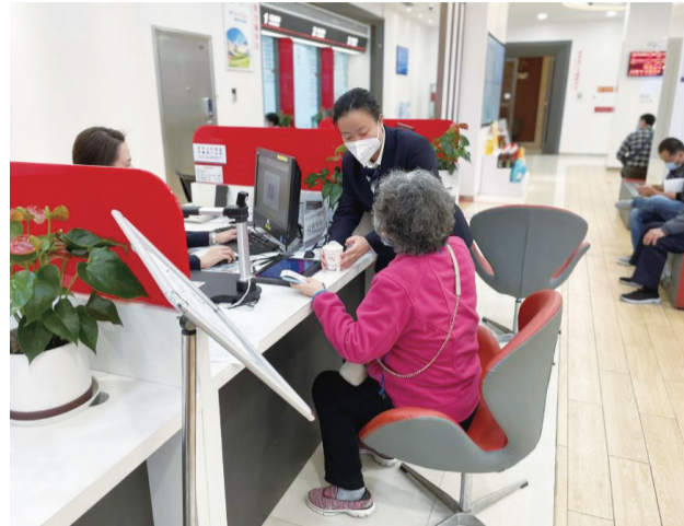
主动为到店老人送温暖

12月以来,工行重庆市分行辖内各分支机构在做好疫情防控的基础上,第一时间结合辖区防疫要求,全力保障营业网点顺利复工,最大限度满足客户需求。