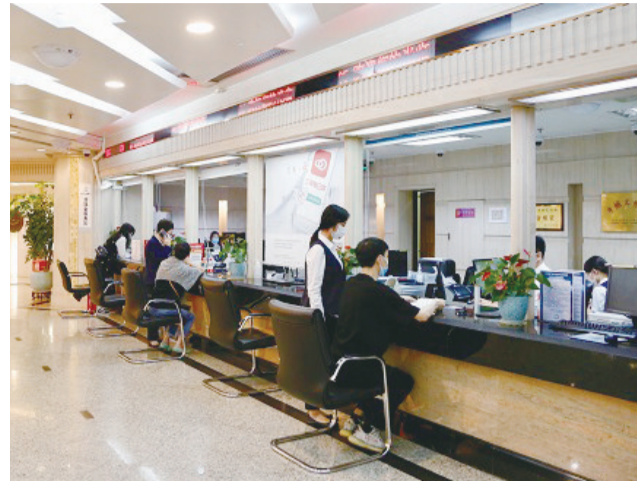
优质高效的金融服务为客户排忧解难

求。12月5日,渝北黄泥磅支行恢复正常营业,为了能够准确并且高效地为客户提供服务,现场员工做好配合,做好客户分流,利用智能柜员机为部分客户办理业务以减少柜面压力。当日,该网点取号198个,总扎账300多笔,赢得了客户的肯定。