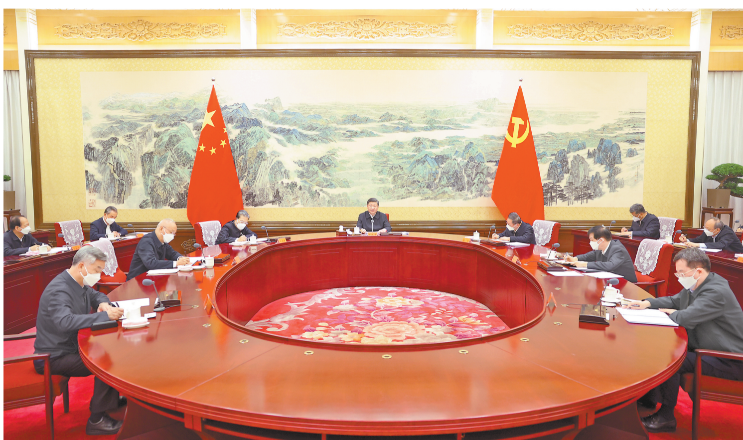
12月26日至27日,中共中央政治局召开民主生活会,中共中央总书记习近平主持会议并发表重要讲话。