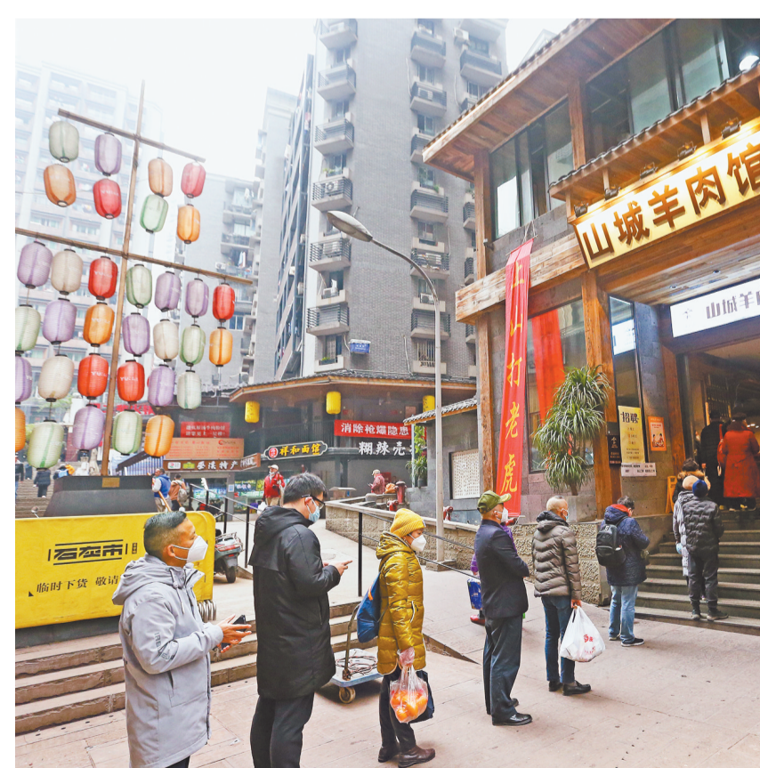
12月22日,渝中区山城羊肉馆,市民排队品尝羊肉。

本报讯(记者 杨妮紫)12月22日是农历冬至节气,许多重庆人都有“冬至吃羊肉”的习俗。当天,重庆日报记者走访发现,各大经营羊肉的餐馆生意火爆,不少市民约上三五好友走进餐馆喝一碗热气腾腾的羊肉汤。 上午11点过,在位于渝中区民生路的老字号餐厅山城羊肉馆门口,远远就看见已经有市民开始排队取号用餐,热腾腾的白色雾气从店里涌出来,满是羊肉的鲜香气味。 “我是老渝中了,今天专门约了朋友来吃羊肉,过冬至,最喜欢这里的市井烟火味道。”市民陈先生说,冬至不来吃顿羊肉,总感觉差了点什么。 排队的人络绎不绝,餐馆里面更是被挤得水泄不通,店员们也忙得不亦乐乎。“22号顾客请用餐。”“来了来了,我们一共三个人!”被叫到号的食客熟练地走向山城羊肉馆二楼,在窗边找到与别人拼桌的空位坐下,粉蒸羊肉、碗碗羊肉汤、红烧羊排等特色菜点了个遍,等着大快朵颐。 在渝中区另一家经营羊肉的食味轩羊肉馆里,同样也是人头攒动,10来张桌子坐得满满当当,餐馆外等着吃饭的人更是排起了长龙。“今天我和老伴专门从渝北开车过来吃,还是原来的老味道!”市民王大爷笑得合不拢嘴。