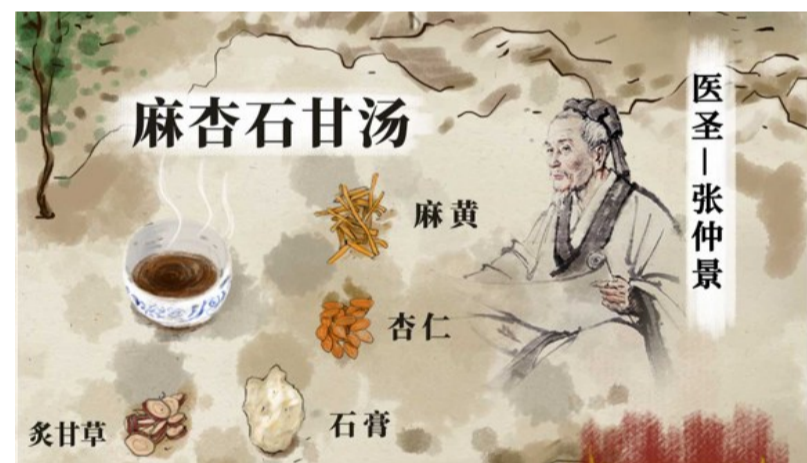
莲花清瘟组方中的麻黄、杏仁、石膏、甘草即为名方《伤寒杂病论》中的麻杏石甘汤

同时,莲花清咳片还针对新冠病毒在多家国内重点实验室和药物安全评价中心开展了系列药理学研究。基础研究结果证实,其在体外、体内均可抑制新冠病毒复制,并降低肺组织炎症,改善肺间质组织增生,抑制感染后体重降低,同时可调节系统性免疫功能,莲花清咳片有积极作用。