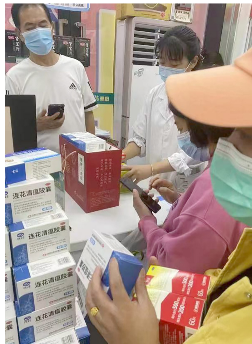
市民选购莲花清瘟