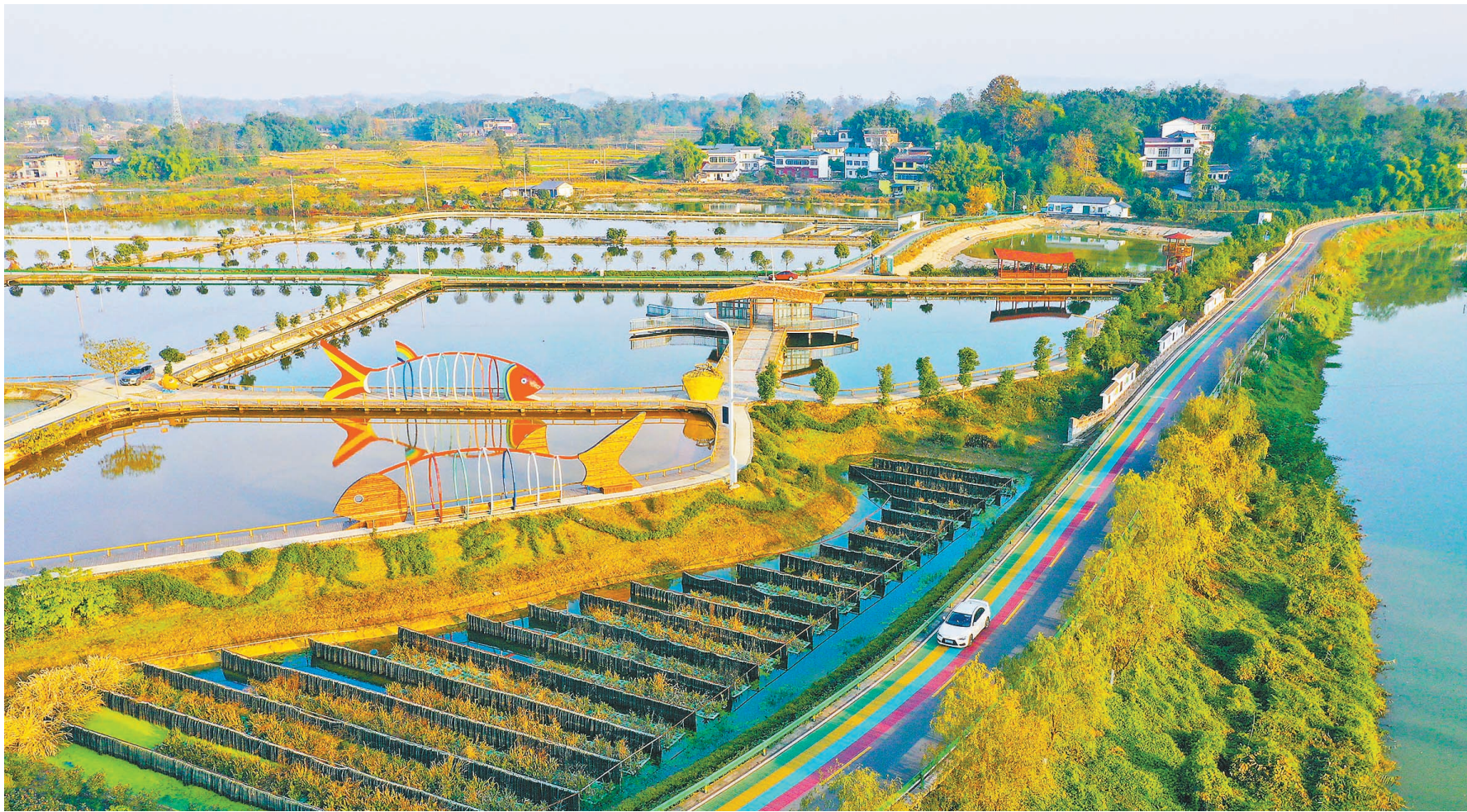
12月18日,梁平区礼让镇川西村渔米路沿线,村落、田园、河流交相辉映,景美如画。当地利用优美的田园风光、竹林资源、湿地系统,发展蔬菜、果树、养鱼、乡村旅游等特色产业,实现农文旅融合发展。

此外,也要切实补足短板弱项,解决好住房安全、饮水安全和医疗保障等“三保障”方面的隐患和问题。