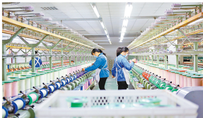
▲12月14日,黔江区工业园区花神丝绸纺织有限公司,女工在车间忙碌。年关将近,该公司加足马力赶制海外订单。