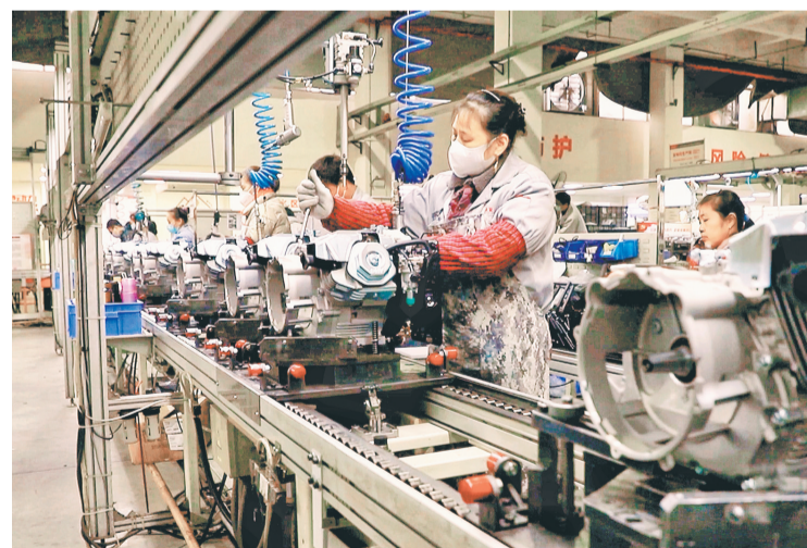
▲12月13日,重庆大江动力设备制造有限公司工人在生产线上工作。连日来,该企业21条智能化生产线马力全开,全力以赴赶订单。