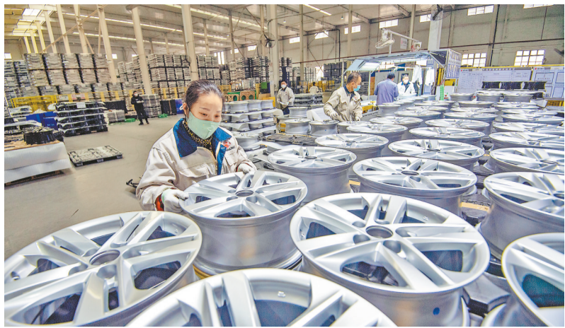
▲12月19日,重庆戴卡捷力轮毂制造有限公司,工人在生产汽车轮毂。该公司全力生产不停歇,11月生产汽车轮毂65万件,同比增长33%。