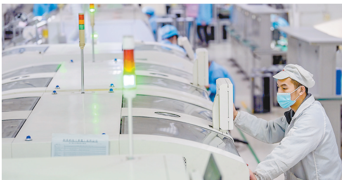
▲12月19日,西部(重庆)科学城,新普科技(重庆)有限公司生产线上,工人正赶制订单产品。该公司开启“赶工”模式,咬定全年目标任务,铆足干劲,赶订单、忙生产。