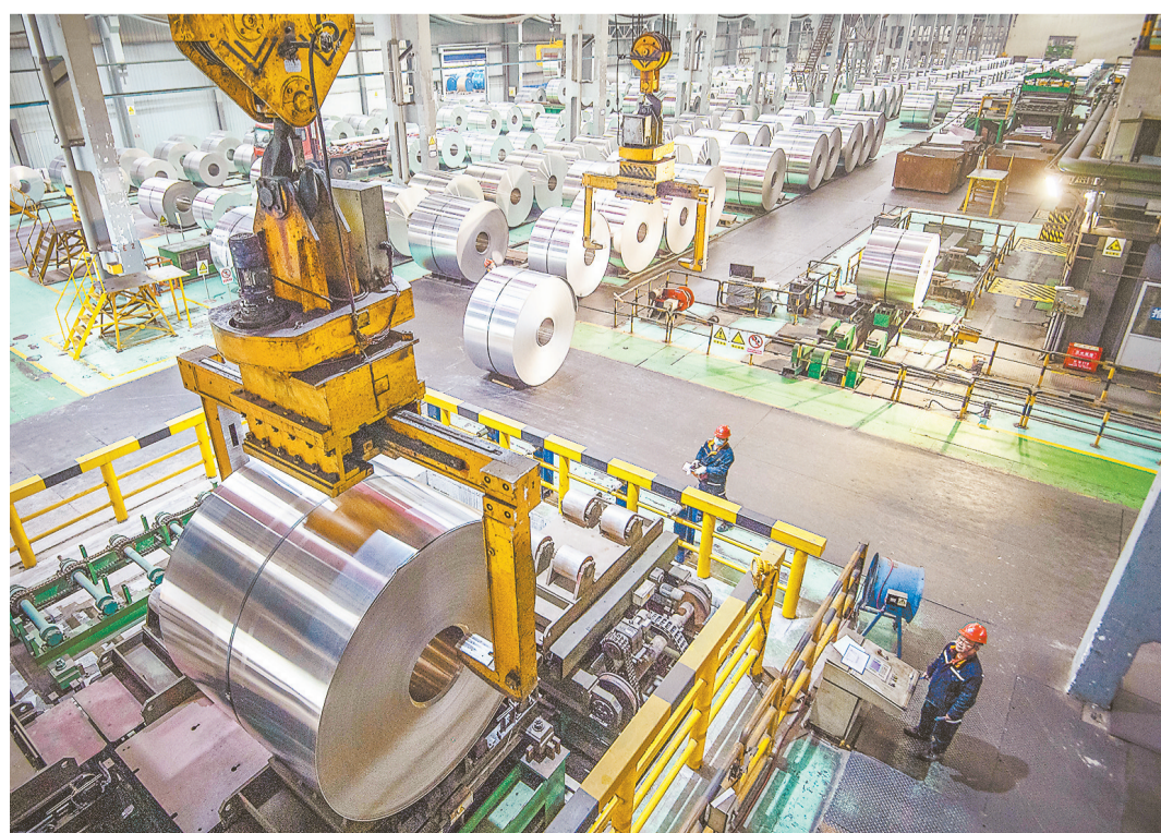
▲12月15日,西南铝生产线,工人正在忙碌。该公司在做好疫情防控工作的同时,紧紧围绕全年生产经营目标不动摇,奋力冲刺。