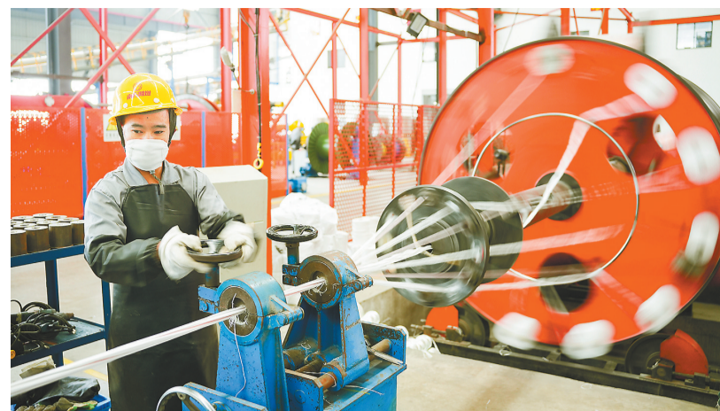
▲12月3日,重庆市南方阻燃电线电缆有限公司生产车间,工人正在操作设备。本轮疫情发生以来,该公司实行闭环生产,确保产能“不掉线”。