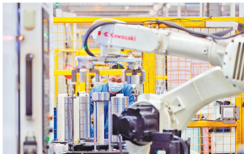
▲12月14日,位于南岸经开区的双环传动(重庆)精密科技有限责任公司,工人在智能生产车间操作机械臂。连日来,该公司开足马力生产,冲刺今年全年3.5亿元的销售目标。