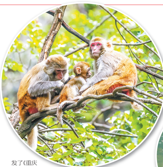
发了《重庆市陆生野生动物收容救护规范（试行）》，对动物收容救护流程、动物安置、档案管理等进行了规范，在设立6家市级野生动物收容救助机构的同时，也鼓励各区县成立野生动物救助点，组建自己的专业救护队伍。

事实上，为了扩大野生动物应急救助范围，早在2019年，市林业局便会同市城市管理局，制定印