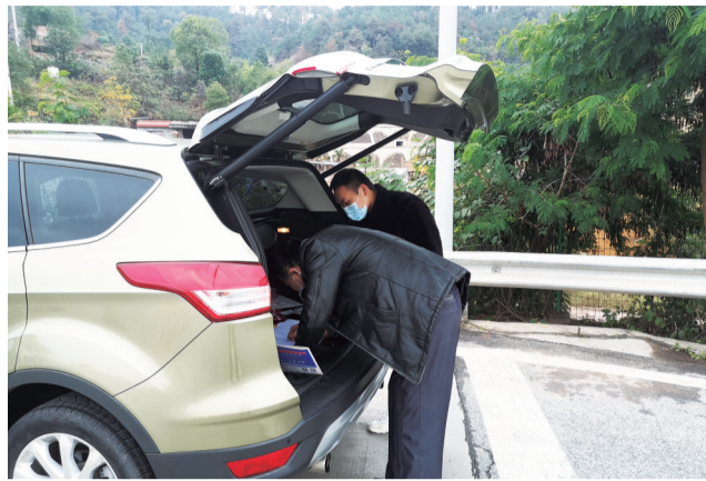
工行北碚支行工作人员在高速路口“接力”完成小微贷款签约