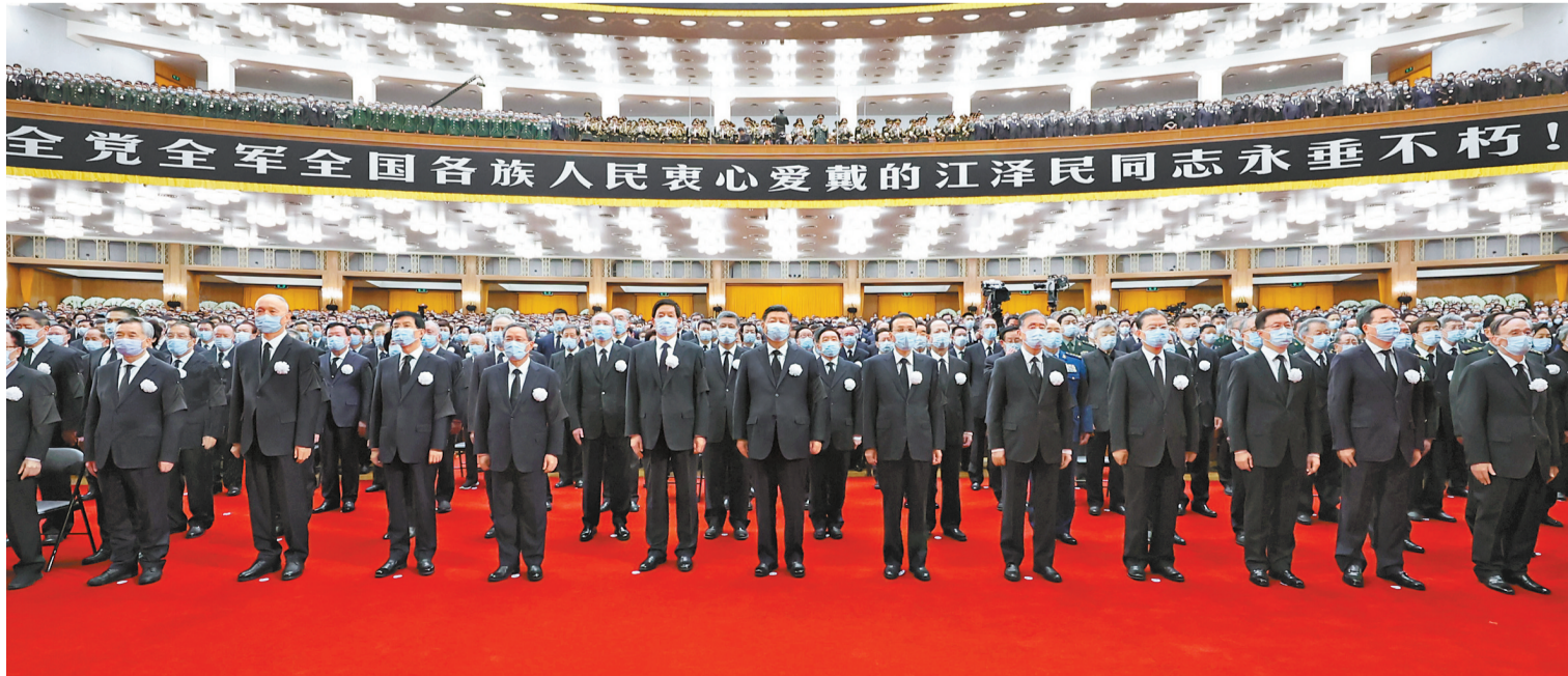
12月6日，中共中央、全国人大常委会、国务院、全国政协、中央军委在北京人民大会堂隆重举行江泽民同志追悼大会。习近平、李克强、栗战书、汪洋、李强、赵乐际、王沪宁、韩正、蔡奇、丁薛祥、李希、王岐山等参加大会。