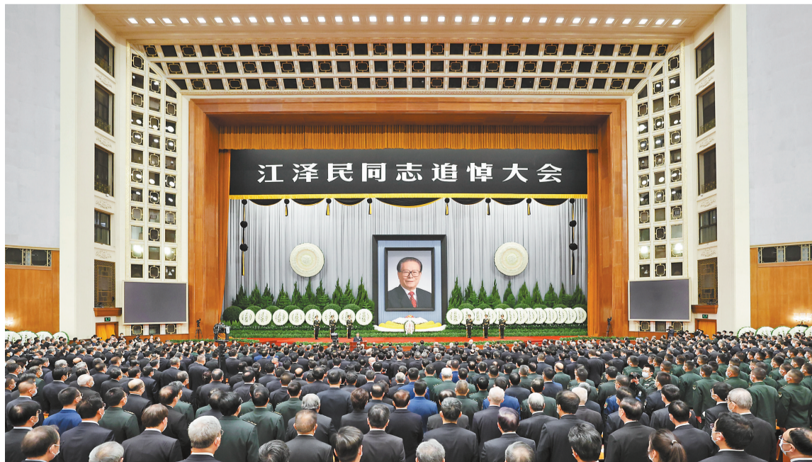
12月6日，中共中央、全国人大常委会、国务院、全国政协、中央军委在北京人民大会堂隆重举行江泽民同志追悼大会。新华社记者 丁海涛 摄