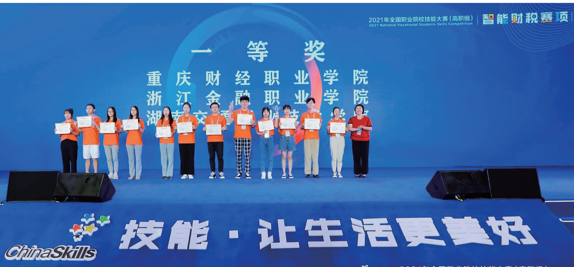
2021年全国职业院校技能大赛(高职组) 智能财税赛项 2021 National Vocational Students Skills Competition