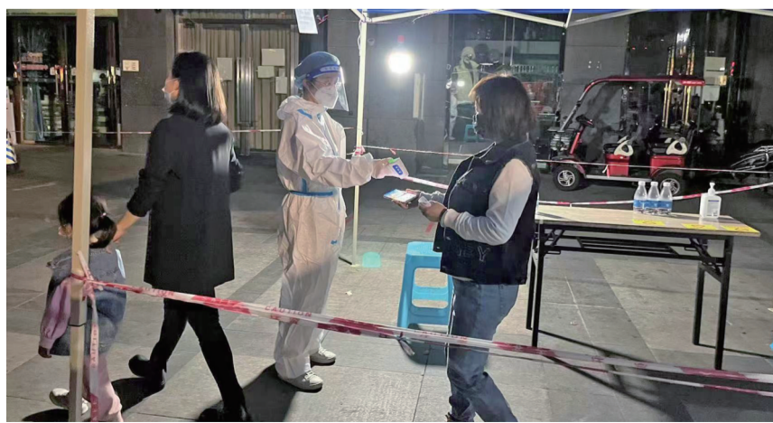
邮储银行重庆分行员工协助核酸检测

原则,合理简化授信服务手续,采取远程业务受理和调查,提升服务效率,确保信贷资金第一时间到账;开辟绿色通道,保证预算内财政资金和疫情防控等财政专项资金及时下拨与划转。